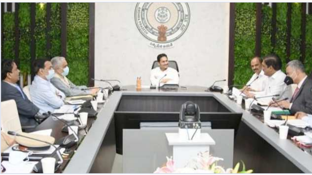
సీఎం వైఎస్ జగన్ సూచనలు

అమరావతి: ఆంధ్రప్రదేశ్ ముఖ్యమంత్రి వైఎస్ జగన్ మోహన్ రెడ్డి అధ్యక్షతన క్యాంప్ కార్యాలయంలో సోమవారం రహదారి భద్రతా మండలి (ఆంధ్రప్రదేశ్ రోడ్ సేఫ్టీ కౌన్సిల్) సమావేశం జరిగింది. ఈ సమావేశంలో.. పలు కీలక అంశాలతో పాటు రోడ్డు ప్రమాదాలు జరగడానికి కారణాలు తదితర అంశాలను సీఎంకు అధికారులు వివరించారు. అనంతరం అధికారులకు కొన్ని సూచనలు చేసిన సీఎం జగన్.. కీలక నిర్ణయాలు కొన్నింటి అమలుకు ఆమోదం సైతం తెలిపారు. ప్రమాదాలకు గురైన వారి ప్రాణాలు కాపాడటం, నిర్ణీత సమయంలో ఆస్పత్రులకు చేర్చడంలో '108' కీలక పాత్ర పోషిస్తున్నాయని అధికారులు సీఎం వైఎస్ జగన్ కు తెలియజేశారు. గోల్డెన్ అవర్లోగా వారిని ఆస్పత్రులకు చేర్చడంతో చాలామంది ప్రాణాలు నిలబడుతున్నాయన్న అధికారులు. రాష్ట్ర వ్యాప్తంగా 1190 బ్లాక్ స్పాట్స్ గుర్తించామని, అందులో 520 స్పాట్స్ను రెడ్డిగ్లై చేశామని అధికారులు వివరించారు. ఆర్ అండ్ బీ నిర్వహిస్తున్న నేషనల్ హైవేలోనూ 78 బ్లాక్ స్పాట్స్ను రెడ్డిగ్లై చేసినట్లు అధికారులు తెలిపారు.