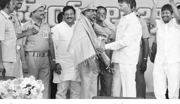
పోలీసుశాఖకు సూచించారు. లాక్స్ హౌస్ మేనేజ్మెంట్ వ్యవస్థ పనితీరు చాలా బాగుందని కొనియాడారు.

అమరావతి: రాష్ట్రంలో రాణీయజం ఉండటానికి వీల్లేదని ముఖ్యమంత్రి చంద్రబాబునాయుడు అన్నారు. విజయవాడలోని ఇందిరాగాంధీ మున్సిపల్ మైదానంలో సోమవారం నిర్వహించిన హోంకార్యల ఆత్మీయ సభలో సీఎం పాల్గొన్నారు. ఈ సందర్భంగా ఆయన మాట్లాడుతూ.. హోంకార్యల క్రమశిక్షణకు మారుపేరుగా ఉంటున్నారని అభినందించారు. రాష్ట్ర ప్రభుత్వం హోంకార్యలను, పోలీసులకు వేరుగా చూడటం లేదన్నారు. ఇది సన్నాస సభ కాదని.. హోంకార్యల చైతన్య సభ అని పేర్కొన్నారు. కేంద్ర సహకరించకపోయినా రాష్ట్ర ప్రభుత్వం ఎన్నో సంక్షేమ కార్యక్రమాలు అమలు చేస్తోందన్నారు. ఆర్థిక వ్యవస్థ సహకారపై మొట్టమొదట హోంకార్యలనే ఆదుకుంటామని హామీ ఇచ్చారు. శాంతి భద్రతలను కాపాడటంలో సాంకేతిక పరిజ్ఞానాన్ని విరివిగా వాడుకోవాలని సీఎం