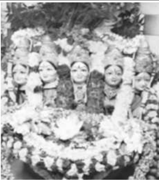
జగన్మోహన్ రెడ్డి, అక్యూటాలో గల శ్రీకాంత్ అమ్మవారి ఆలయంలో శ్రీ గాయత్రి దేవి అలంకరణతో భక్తులకు దర్శనమిచ్చారు.

ఈ వ్యవహారంపై పుదుచ్చేరి లెస్ట్రోనెట్ గవర్నర్ కిరణ్ బేడికి, విజిలెన్స్ అధికారులకు స్థానిక పరిపాలనాధికారి సిఫార్సు చేయాలని డిమాండ్ చేశారు. అన్ని శాఖలలో అవినితి పెచ్చుమీరిపోతుందని దీనిని అరికట్ట వలసిన బాధ్యత పుదుచ్చేరి ఉన్నతాధికారులపై ఉందని వారు అన్నారు. ఈ విషయంపై ఆవ సరం అయితే న్యూఢిల్లీ విజిలెన్స్ అధికారులకు ఫిర్యాదుచేయనున్నట్లు పలువురు కొనుగోలు దారులు హెచ్చరించారు.