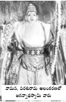
వామన, పరశురామ అలంకరణలో జగన్నాథస్వామి వారు