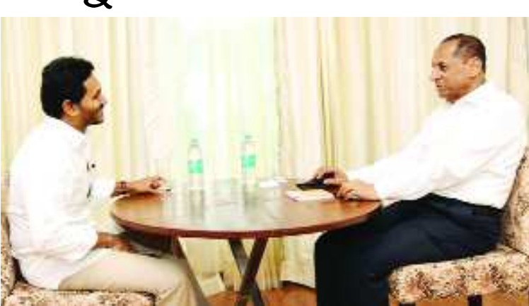
విజయవాడ : బడ్జెట్ సమావేశాల సందర్భంగా గవర్నర్తో సీఎం జగన్ భేటీ. మోహన్ రెడ్డి గవర్నర్ నరసింహారెడ్డితో భేటీ నేపథ్యంలో వివిధ అంశాలపై చర్చించే అయ్యారు. ఈ క్రమంలో సీఎం జగన్ క్రమంలో ముఖ్యమంత్రి వైఎస్ జగన్ నగరంలోని గేటివే