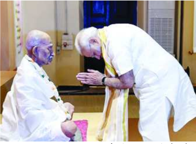
రూపొందించనున్నామన్నారు. మహాత్మా గాంధీ బోధనలను ప్రజల్లోకి తీసుకెళ్లడానికి యాత్ర కొనసాగించాలన్నారు. ఇటీవల బడ్జెట్ సందర్భంగా గాంధీకి గొప్ప నివాళిగా వికీపీడియా తరహాలో గాంధీపీడియా రూపొందించనున్నామని ఆర్థిక మంత్రి నిర్మలా సీతారామన్ వెల్లడించిన విషయం తెలిసింది.

దిల్లీ: జాతీయ మహాత్మాగాంధీ 150వ జయంతిని పురస్కరించుకొని భాజపా పార్లమెంటు సభ్యులు ఒక్కొక్కరు 150కి.మీ పాదయాత్ర చేపట్టాలని ప్రధాని నరేంద్ర మోదీ సూచించారు. ఈ మేరకు మంగళవారం జరిగిన పార్లమెంటరీ ప్రాక్టీ సమావేశంలో ఆయన ఎంపీలను కోరినట్లు పార్లమెంటరీ వ్యవహారాల శాఖ మంత్రి ప్రహ్లాద్ జోషి వెల్లడించారు. గాంధీ జయంతి అయిన ఆగ్టోబర్ 2 నుంచి సర్దార్ వల్లభాయ్ పటేల్ జయంతి అయిన అక్టోబర్ 31 మధ్య ఒక్కో రోజు 15కి.మీ చొప్పున మొత్తం 150 కి.మీ పూర్తి చేయాలని తెలిపారు. అలాగే రాజ్యసభ సభ్యులు భాజపా బలహీనంగా ఉన్న నియోజకవర్గాల్లో యాత్ర చేపట్టాలని కోరారు. పాదయాత్ర సందర్భంగా గ్రామాల్లో మొక్కలు నాటడం, ప్రకృతి వ్యవసాయంపై ప్రజల్లో అవగాహన పెంచాలని మోదీ ఆదేశించినట్లు జోషి తెలిపారు. అలాగే గ్రామాల పునరుజ్జీవం, స్వయం సమృద్ధిపై దృష్టి సారించేలా యాత్ర కార్యచరణని