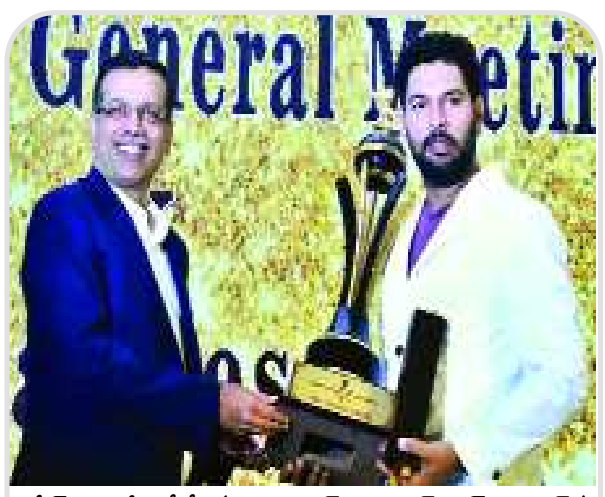
కోల్కతాలో జనీసీ (ఇండియన్ ఛాంబర్ ఆఫ్ కామర్స్) 91 వ వార్షిక సర్వసభ్య సమావేశంలో భారత మాజీ క్రికెటర్ యువరాజ్ సింగ్ కు జీవిత సాఫల్య పురస్కారాన్ని అందజేస్తున్న పారిశ్రామికవేత్త సంజీవ్ గోయెంకా