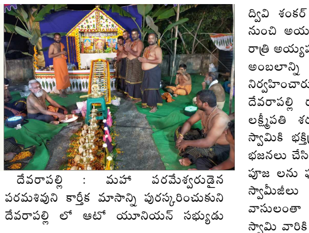
దేవరావల్లి : మహా పరమేశ్వరుడైన పరమశివుని కార్తీక మాసాన్ని పురస్కరించుకుని దేవరావల్లి లో ఆటో యూనియన్ సభ్యుడు