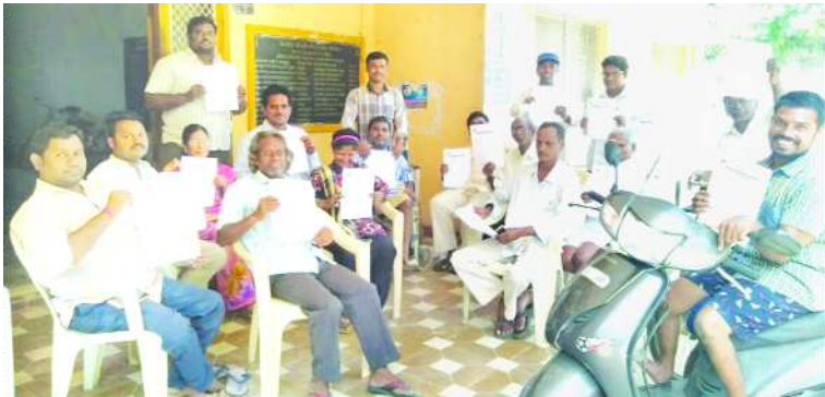
ప్రపంచ వికలాంగుల దినోత్సవం పోస్టరు ఆవిష్కరిస్తున్న దివ్యాంగుల సంఘం నాయకులు