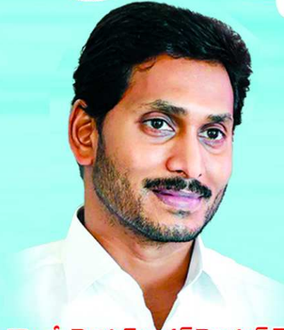
గౌ. శ్రీ వై.యస్.బి.గనమోహన్ రెడ్డి ఆంధ్రప్రదేశ్ ముఖ్యమంత్రివర్గము

భీమిలి చీఫ్ (మెయిన్ స్టేజీ) తగరపువలస (వుట్ బాల్ గ్రౌండ్)