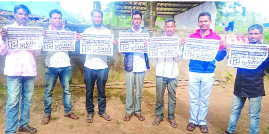
ఏజెన్సీ బండ్ల గోడవతిక అవిచ్ఛిన్నం గిరిజన సంఘం నాయకులు

అనంతగిరి : హుకుంపేట మండలం అనంతగిరిలో ఈనెల 12వ తేదీన జరిగే ఏజెన్సీ బండ్లను విజయవంతం చేయాలని హుకుంపేట గిరిజన సంఘం నాయకులు పత్రికల ద్వారా గిరిజన ప్రజలకు తెలియ జేశారు. పొడు భూములకు పట్టాలు వెంటనే ఇవ్వాలని, ఏజెన్సీ అటవీ పై గిరిజనులకే అధికారం ఉండాలని, రైతు భరోసా డబ్బులు ఇవ్వాలని ఈ నెల 12(మంగళవారం) ఏజెన్సీ బండ్ల జరుగుతుంది. కావున రైతులు, యూత్ బండ్లకు హుకుంపేటకు వచ్చి పాల్గొవాలని పత్రికల ద్వారా కోరడమైంది.