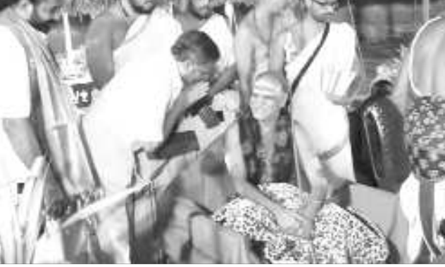
రణలు మంగళ వాయి ద్వాలు నడుమ ఆ ప్రాంతమంతా ఆధ్యాత్మిక వాతావరణం చోటు చేసుకుంది.