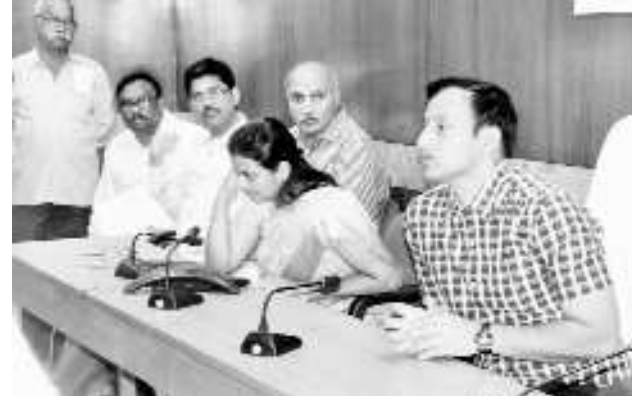
సమస్యల పరిష్కార నిమిత్తం సంబంధిత అధికారులను ఆదేశించారు.