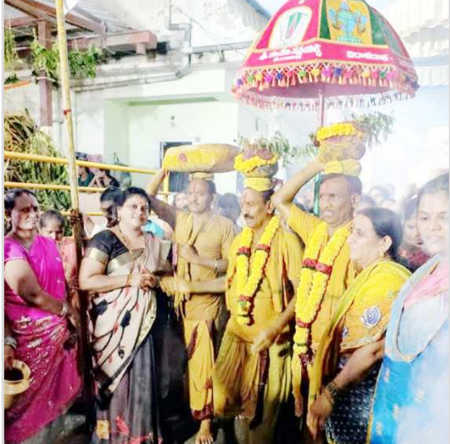
మాధవధారులు అమ్మవారిని ఘనంగా ఊరేగిస్తున్న దృశ్యం.

మాధవధార (విజయభాను న్యూస్): గ్రేటర్ విశాఖ 50 వ వార్డు మాధవధారలో కొలువైయున్న శ్రీ కుంచమాంబ అమ్మవారి మహోత్సవాలు మాధవధార గ్రామస్తులు, మాధవ యువజన సమాజం (ఆద్ హక్ కమిటీ) ఆధ్వర్యంలో మంగళవారం ఘనంగా నిర్వహించారు. ముందుగా వంశపారంపర్యంగా వస్తున్న కంచరాస కుటుంబ సభ్యులు అమ్మవారికి విశేష పూజలు నిర్వహించారు. అనంతరం అమ్మవారిని ప్రముఖులు, అధికారులు, అసాధికారులు, ప్రజాప్రతినిధులు, భక్తులు దర్శించు కున్నారు. కమిటీ వారు భక్తులకు ఎటువంటి అసౌకర్యాలు కలగకుండా అన్ని ఏర్పాట్లు చేశారు.