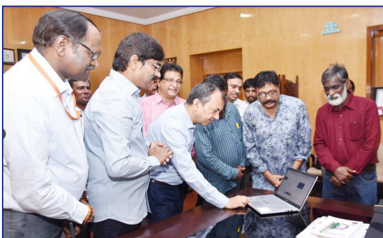
ఆంధ్రవిశ్వవిద్యాలయం : అల్లారి సీతారామరాజు జీవితంపై విశ్రాంత పోలీసు ఉన్నతాధికారి తదితరులు పాల్గొన్నారు.