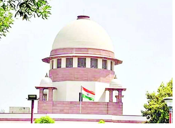
గడువులోపు విచారణ ముగించాలని తాము ఆదేశించలేమని సర్వోన్నత న్యాయస్థానం స్పష్టం చేసింది. ఈ కేసును హైకోర్టు త్వరగా పరిష్కరిస్తుందని ఆశిస్తున్నట్లు ధర్మాసనం పేర్కొంది. రాష్ట్ర ప్రభుత్వం వాదనలపై న్యాయవాది నారమన్ అభిప్రాయాన్ని ధర్మాసనం ప్రత్యేకంగా

దిల్లీ: ఏపీ ప్రభుత్వానికి సుప్రీం కోర్టులో మరోసారి గట్టి ఎదురు దెబ్బ తగిలింది. పాలనా వికేంద్రీకరణ, సీఆర్డీపి రద్దు చట్టాలపై ఏపీ హైకోర్టు ఇచ్చిన స్టేట్స్ కో ఉత్తర్వులను రద్దు చేయాలని కోరుతూ రాష్ట్ర ప్రభుత్వం సుప్రీంకోర్టును ఆశ్రయించింది. సిటిపిన్ పై విచారణ చేపట్టిన జస్టిస్ అశోక్ భూషణ్, జస్టిస్ ఆర్.సుభాష్ రెడ్డి, జస్టిస్ ఎం.ఆర్.షాలత్ కూడిన ధర్మాసనం రాష్ట్ర ప్రభుత్వం అభ్యర్థనను తోసిపుచ్చింది. హైకోర్టు విచారణ చేస్తున్నందున ఈ దశలో జోక్యం చేసుకోలేమని తెలిపింది. మూడు రాజధానుల వ్యవహారంపై గురువారం నేడు హైకోర్టులో విచారణ ఉన్నందున తమ వద్దకు రావడం సరికాదని సుప్రీంకోర్టు అభిప్రాయపడింది. నిర్ణీత గడువులో హైకోర్టులో విచారణ ముగించేలా ఆదేశించాలని రాష్ట్ర ప్రభుత్వం కోరగా... పలాన