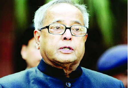
అగస్టు 10న ప్రణబ్ కు అత్యవసర శస్త్రచికిత్స జరిగిన తరువాత ఆయనకు కరోనా సోకింది. అప్పటి నుంచి ఆయన ఆరోగ్య స్థితిలో ఎలాంటి మార్పు ఉండడం లేదు.

న్యూ ఢిల్లీ : మాజీ రాష్ట్రపతి ప్రణబ్ ముఖర్జీ ఆరోగ్య పరిస్థితి రోజురోజుకూ క్షీణిస్తోంది. తాజాగా ఆయన తీవ్ర (డీవ్)కోమలలోకి వెళ్లిపోయారని, వెంటిలేటర్ మద్దతుతో కృత్రిమ శ్వాస అందజేస్తున్నామని ఆర్మీ రీసెర్చ్ అండ్ రిఫరల్ దవాఖాన బుధవారం తెలిపింది. మెదడుకు శస్త్రచికిత్స జరిగిన తరువాత కరోనా సోకడంతో 16 రోజులుగా ప్రణబ్ దవాఖానలో చికిత్స పొందుతున్న సంగతి తెలిసిందే. ప్రస్తుతం ఊపిరితిత్తుల్లో ఇన్ ఫెక్షన్ ఉండడం వల్ల ప్రణబ్ కు చికిత్స అందజేస్తున్నామని, నిన్నటి నుంచి ఆయన మూత్రపిండాలు కూడా క్షీణిస్తున్నట్లు కనబడుతోందని వైద్యులు తెలిపారు.