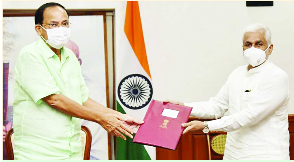
వ్యవసాయోత్పత్తులు, మత్స్య, ప్లాంటేషన్, కొబ్బరి పీచు, పసుపు ఉత్పత్తుల ఎగుమతులకు సంబంధించి వాణిజ్య శాఖకు చెందిన పార్లమెంటరీ స్థాయి సంఘం ఆమోదించిన 154వ నివేదికను స్థాయి సంఘం చైర్మన్ వి.విజయసాయి రెడ్డి బుధవారం ఢిల్లీలో రాజ్యసభ అధ్యక్షులు ఎం.వెంకయ్య నాయుడుకు సమర్పించారు.

అభిప్రాయపడింది. అందుకోసం తీసుకోవలసిన ఎగుమతులపై స్థాయి సంఘం జరిపిన అధ్యయనం, చర్యలను వివరిస్తూ స్థాయి సంఘం 154వ నివేదికలో సిఫార్సులకు సంబంధించిన 154వ నివేదికను ప్రభుత్వానికి సిఫార్సు చేసింది. వ్యవసాయ, మత్స్య, బుధవారం ఢిల్లీలో స్థాయి సంఘం చైర్మన్ ప్లాంటేషన్, కొబ్బరిపీచు, పసుపు ఉత్పాదనల వి.విజయసాయి రెడ్డి