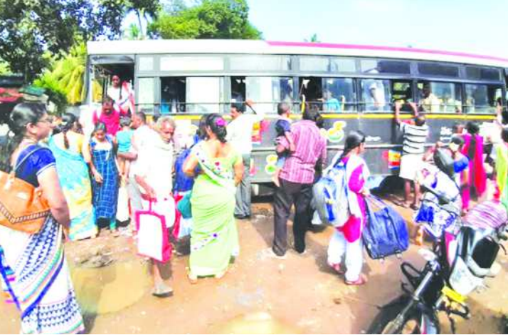
దేవరాపల్లిలో ఆర్టీసీ బస్సుల కోసం ఎగబడుతున్న ప్రయాణికులు

దేవరాపల్లి : విశాఖపట్నం నుంచి దేవరాపల్లి కి వచ్చే 12డి, 55డి, 333డి ఆర్టీసీ బస్సుల రాకపోకలకు వేళాపాళా లేకుండా పోతుంది. కొంత కాలంగా ఇదే పరిస్థితి కొనసాగుతున్న కనీసం పట్టణంలోనే నాడుకు కరువయ్యారు. ఇష్టానుసారంగా నచ్చిన వేళలో బస్సులు నడుపుతున్న ఆర్టీసీ అధికారుల తీరుపై ప్రయాణికులు ఆగ్రహం వ్యక్తం చేస్తున్నారు. అటు విశాఖపట్నం ఆర్టీసీ కాంప్లెక్స్ వద్ద ఇటు దేవరాపల్లి బస్సు స్టేషన్ వద్ద గంటల తరబడి బస్సుల కోసం ఎదురుచూస్తున్న ఫలితం కనిపించలేదని ప్రయాణికులు ఆవేదన వ్యక్తం చేస్తున్నారు. ఎప్పుడు వస్తాయో.. ఎప్పుడు పోతాయో తెలియని దుస్థితిలో ప్రయాణికులు ఉన్నారు. వస్తే ఒకసారి ఒకటి వెనక ఒకటి, పోతే ఒకసారి గొలుసు బండిలా సాగుతున్నాయి. అందుకు ఆర్టీసీ అధికారుల పర్యవేక్షణ లోపమా లేక సిబ్బంది నిర్లక్ష్యమా అని ప్రయాణికులు మండిపడుతున్నారు. దీనితో పాటు అసకాపల్లి, గాజుపాక నుంచి వచ్చే బస్సులు తీరు కూడా ఇంతేనని