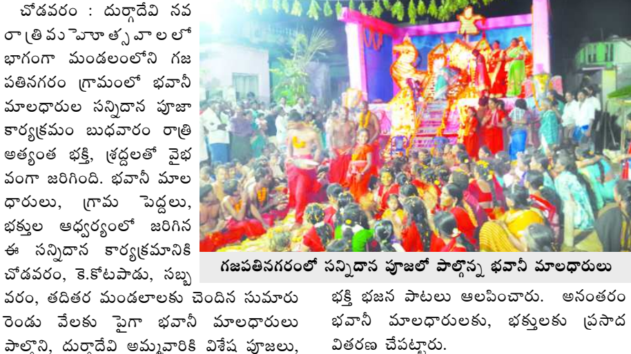
గజపతినగరంలో సన్నిధాన పూజలో పాల్గొన్న భవానీ మాలధారులు

చోడవరం : దుర్గాదేవి సవ రాత్రి మహాత్మ్యాలలో భాగంగా మండలంలోని గజ పతినగరం గ్రామంలో భవానీ మాలధారుల సన్నిధాన పూజా కార్యక్రమం బుధవారం రాత్రి అత్యంత భక్తి, శ్రద్ధలతో వైభవంగా జరిగింది. భవానీ మాల ధారులు, గ్రామ పెద్దలు, భక్తుల ఆధ్వర్యంలో జరిగిన ఈ సన్నిధాన కార్యక్రమానికి చోడవరం, కె.కోటపాడు, నల్లపేట, తదితర మండలాలకు చెందిన సుమారు 2000 వేలకు పైగా భవానీ మాలధారులు పాల్గొని, దుర్గాదేవి అమ్మవారికి విశేష పూజలు, భక్తి భజన పాటలు ఆలపించారు. అనంతరం భవానీ మాలధారులకు, భక్తులకు ప్రసాద వితరణ చేపట్టారు.