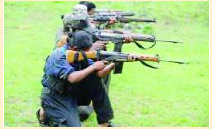
కొరాపూట్: ఆంధ్రప్రదేశ్, ఒడిశా సరిహద్దు కాలూల మోతతో దద్దరిల్లింది. ఆంధ్రా సరిహద్దులోని పదునా పోలీస్ స్టేషన్ పరిధిలో మావోయిస్టులు, భద్రతా సిబ్బంది మధ్య ఎన్కౌంటర్ జరిగింది. ఈ [తరువాయి 2లో..]