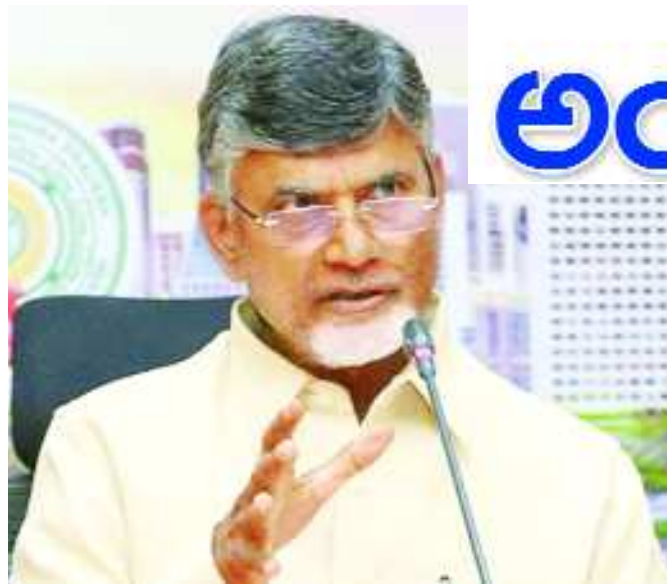
అమరావతి: రాజధానిలో గ్యాలరీ నిర్మాణం సింగపూర్ సహకారంతో ప్రారంభించామని ముఖ్యమంత్రి చంద్రబాబు వ్యాఖ్యానించారు. స్టార్లప్ ఏరియా ఫేస్ 1 దగ్గర వెల్లెకం గ్యాలరీకి సీఎం గురువారం శంకుస్థాపన