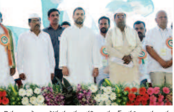
రైతులు ఎలా సోమరులవుతారని రాహుల్ ప్రశ్నించారు. ఈ కార్యక్రమంలో సీఎం సిద్ధరామయ్య, లోక్ సభలో కాంగ్రెస్ పక్ష నేత మల్లికార్జున ఖల్లె తదితరులు పాల్గొన్నారు.

న్యూఢిల్లీ : ప్రధాని నరేంద్రమోదీ సారథ్యంలోని బీజేపీ ప్రభుత్వం తప్పుడు హామీలతోనే కాలం గడుపుతున్నదని కాంగ్రెస్ పార్టీ ఉపాధ్యక్షుడు రాహుల్ గాంధీ ఆరోపించారు. రైతులు, నిరుద్యోగుల సమస్యలను పట్టించుకోవడం లేదన్నారు. యూపీఏ ప్రభుత్వ హయాంలో వెనుకబడిన హైదరాబాద్ కర్ణాటక ప్రాంతానికి ప్రత్యేక హోదా కల్పిస్తూ రాజ్యాంగంలో 371 (జే) అధికరణానికి సవరణలో కీలక పాత్ర పోషించిన రాహుల్ గాంధీని కర్ణాటక ప్రదేశ్ కాంగ్రెస్ కమిటీ సన్మానించింది. ఈ సందర్భంగా ఆయన మాట్లాడుతూ.. కేంద్ర ఆర్థిక మంత్రి అరుణ్ జైట్లీ పంట రుణాల మాఫీ తమ ప్రభుత్వ పాలన కారణమే, రైతులను సోమరులను చేయడంపైనే ఆయన రాహుల్ గుర్తు చేశారు. ఇదే ప్రభుత్వం పారిశ్రామిక రుణాలు మాఫీ చేసినప్పుడు 10 మంది అత్యంత సంపన్న పారిశ్రామికవేత్తలు సోమరులు కావచ్చు