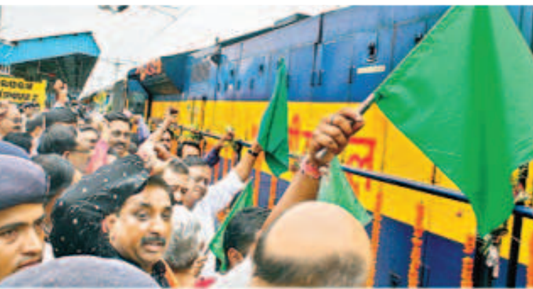
నెరవేరించిన ఎంపీలు తెలిపారు. దీని వల్ల అలహాబాద్ లోని త్రివేణి సంగమం, అమృత్ నగర్ స్వర్ణ మందిరం, అమర్ నాథ్ వెళ్లడం లాంటి యాత్రకులకు ఎంతో మేలు జరుగుతుందని హర్షం వ్యక్తం చేశారు.

బరగడ్ : సంబల్ పూర్ నుంచి జమ్మ వెళ్లే జమ్మతవి ఎక్స్ ప్రెస్ రైలును సంబల్ పూర్ రైల్వే స్టేషన్ లో ప్రారంభించారు. రైల్వే శాఖా మంత్రి సురేష్ ప్రభు విడియో కాన్ ఫరెన్స్ ద్వారా దిల్లీలో పచ్చజెండా పూజ రైలు ప్రారంభించగా అదే సమయానికి సంబల్ పూర్ స్టేషన్ లో ప్రజాప్రతినిధులు పచ్చజెండా పూజ రైలుని ప్రారంభించారు.