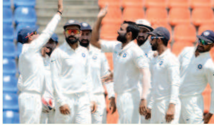
సాధించాడు. ఇక ఒకే ఓవర్లో మూడు పరుగులు సిక్సర్లు కొట్టడం మూడు నెలల్లో పాండ్యాకి మూడోసారి. చాంపియన్స్ ట్రోఫీ పై పాకిస్థాన్ పై రెండు ఓవర్లలో పరుగుగా మూడేసి సిక్సర్లు బాదాడు. ఇక ఎనిమిదో స్థానంలో ఆడుతూ.. అత్యంత వేగంగా సెంచరీ చేసిన ఇండియన్ బ్యాట్స్ మన్ గానూ పాండ్యా నిలిచాడు.

క్యాండీ: హార్దిక్ పాండ్యా.. ఇన్నాళ్లు వన్డేలు, టీ20లకే పరిమితమైన ఈ హార్డ్ హిట్టర్ ఇప్పుడు టెస్ట్ క్రికెట్లోనూ తనదైన మార్క్ చూపించాడు. శ్రీలంకతో మూడో టెస్ట్ తొలి ఇన్నింగ్స్ లో అతను విశ్వరూపం చూపించాడు. ఆడుతున్నది టెస్ట్ మ్యాచ్ అయినా.. టీ20 స్టైల్లో చెలరేగాడు. కేవలం 86 బంతుల్లోనే టెస్ట్ లో తొలి సెంచరీ చేశాడు పాండ్యా. అందులో 7 సిక్సర్లు, 8 ఫోర్లు ఉన్నాయి. ఈ క్రమంలో మరో అరుదైన రికార్డును అందుకున్నాడతడు. తొలి గంటలోనే మూడు వికెట్లు తీసి ఊపు మీదున్న లంక బౌలర్లకు దిమ్మదిరిగే షాకిచ్చాడు పాండ్యా. ముఖ్యంగా స్పిన్నర్ సందకన్ బౌలింగ్లో చెలరేగి ఆడాడు. ఒకే ఓవర్లో ఏకంగా 26 రన్స్ చేశాడు. టెస్ట్ క్రికెట్లో ఒక ఓవర్లో అత్యధిక పరుగులు చేసిన భారత బ్యాట్స్ మన్ గా రికార్డు సృష్టించాడు పాండ్యా. ఇన్నింగ్స్ 116వ ఓవర్లో రెండు ఫోర్లు, మూడు సిక్సర్లు బాదాడు. తొలి రెండు బంతులు ఫోర్లు, ఆ తర్వాత మూడు పరుగులు సిక్సర్లు.. ఆరో బంతి డాట్.. ఇలా ఒకే ఓవర్లో మొత్తం 26 పరుగులు. గతంలో 24 పరుగులతో కనీస్ దేవ్, సందీప్ పాటిల్ పేరు మీదున్న రికార్డును పాండ్యా అధిగమించాడు. ఈ లిస్ట్లో 28 పరుగులతో ట్రియాన్ లారా పేరిట వరల్డ్ రికార్డు ఉంది. 2004లో అతను సౌతాఫ్రికాపై ఈ ఘనత సాధించాడు. ఇక ఒకే ఓవర్లో మూడు పరుగులు సిక్సర్లు కొట్టడం మూడు నెలల్లో పాండ్యాకి మూడోసారి. చాంపియన్స్ ట్రోఫీ పై పాకిస్థాన్ పై రెండు ఓవర్లలో పరుగుగా మూడేసి సిక్సర్లు బాదాడు. ఇక ఎనిమిదో స్థానంలో ఆడుతూ.. అత్యంత వేగంగా సెంచరీ చేసిన ఇండియన్ బ్యాట్స్ మన్ గానూ పాండ్యా నిలిచాడు.