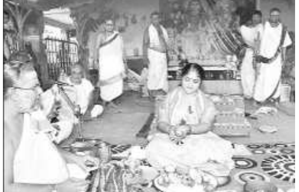
పాటు ఇతర ప్రాంతాల్లో వివాహం చేసుకున్న వారు అమ్మవారి ఆశీస్సుల కోసం ఇండ్రకీలాద్రిపైకి చేరుతున్నారు. వారికి నూతనంగా నిర్మించిన ఆశీర్వాదన మండపంలో వేద పండితులు ఆశీర్వాదనం చేయడంతో పాటు కుంకుమ ప్రసాదం, గాజులు, శక్తి కంకణాలను అందజేశారు.