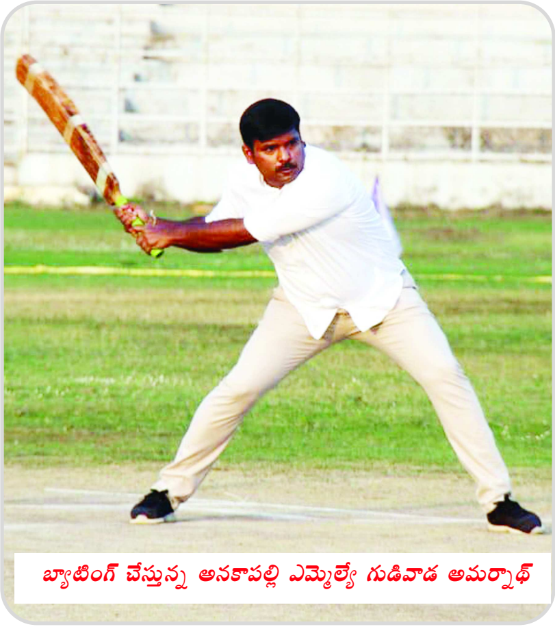
బ్యాటింగ్ చేస్తున్న ఆనకాపల్లి ఎమ్మెల్యే గుడివాడ అమర్నాథ్