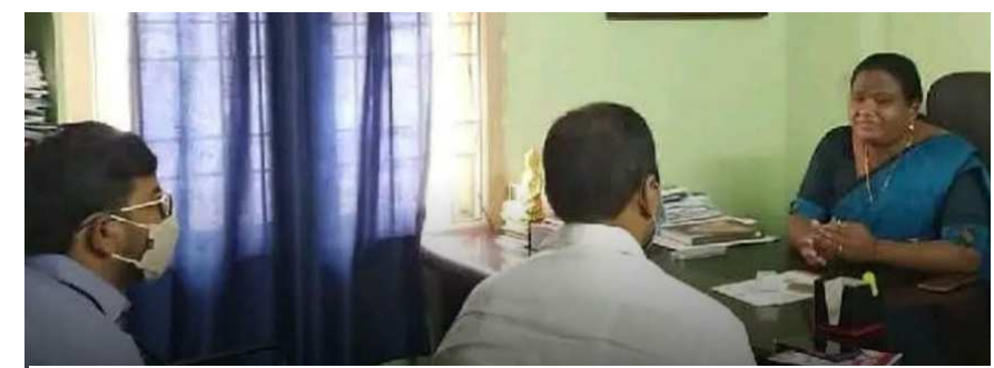
అధికారులతో మాట్లాడుతున్న అరకు ఎంపి మాధవి

కొయ్యూరు (విజయభాను న్యూస్) : గిరి విద్యార్థులను క్రీడా రంగంలో మరింత ప్రోత్సహించాలని అరకు ఎంపి గొడ్డెటి మాధవి అన్నారు. శుక్రవారం ఆమె జిల్లా క్రీడా అధికారులతో సమావేశమయ్యారు. ఈ సందర్భంగా ఎంపి మాధవి మాట్లాడుతూ గిరిజన విద్యార్థులకు వారి వైపునాన్ని ప్రదర్శించేందుకు కేంద్ర రాష్ట్ర ప్రభుత్వాల ప్రోత్సాహం ఉండాలన్నారు. ఈ దిశగా అధికారులు దృష్టిసారించాలన్నారు. అరకులో మినీ స్టేడియం ఏర్పాటు చేయాలని, పాడేరులో ఆసంపూర్తిగా ఉన్న ఆర్గర్ స్టేడియం పూర్తి చేయాలని సూచించారు.