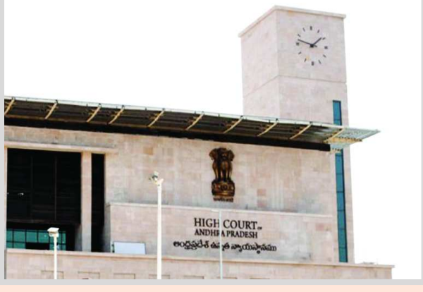
అమరావతి: ఏపీలో ఇంటర్ ఆన్లైన్ అడ్మిషన్ల ప్రక్రియపై హైకోర్టు స్టే విధించింది. ఈ అంశంలో ఏ నిబంధనల ప్రకారం

ముందుకెళ్తున్నారని విద్యాశాఖను ఉన్నత న్యాయస్థానం ప్రశ్నించింది. ఆన్లైన్ అడ్మిషన్ల విషయంలో దాఖలైన పిటిషన్పై హైకోర్టు విచారణ చేపట్టింది. ఆన్లైన్ అడ్మిషన్ల వల్ల విద్యార్థుల భవిష్యత్పై ప్రభావం పడే అవకాశముందని పిటిషన్ తరపు న్యాయవాది వాదనలు వినిపించారు. అడ్మిషన్ల సమయంలో విద్యార్థికి కౌన్సిలింగ్ ఇచ్చి ఏ గ్రూపులో ఆసక్తి ఉందో తెలుసుకుని సీటు కేటాయిస్తారని.. ఆన్లైన్ అడ్మిషన్ వల్ల విద్యార్థి సరైన గ్రూపును ఎంచుకోలేదనే అభిప్రాయాన్ని కోర్టుకు తెలిపారు. దీనిపై పూర్తి సమాచారం అందించేందుకు సమయం ఇవ్వాలని ప్రభుత్వం తరపు న్యాయవాది కోరారు. దీంతో హైకోర్టు తదుపరి విచారణను ఈనెల 10కి వాయిదా వేస్తూ అప్పటి వరకు స్టే విధించింది. ఈలోపు కౌంటర్ అఫిడవిట్ దాఖలు చేయాలని ప్రభుత్వాన్ని ఉన్నత న్యాయస్థానం ఆదేశించింది.