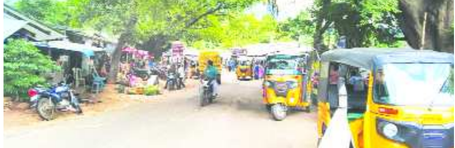
వెలవెలబోతున్న కాశీపట్నం వారపు సంత

అనంతగిరి : అనంతగిరి మండలంలో గల దముకు కాశీపట్నం వారపు సంతలు వెలవెల బోయాయి. మణ్యేములో గత కొద్ది రోజులుగా విస్తారంగా వర్షాలు పడుతున్న సంగతి తెలిసిందే గెడ్డలు ఎక్కువగా రావడం వలన ఇప్పటికే పలు గిరిజన గ్రామాలకు బయటి ప్రపంచంతో రాక పోకలు తెగిపోయే ఈ నేపథ్యంలో బుధవారం వారపు సంతలన్నీ కళావిహీనంగా తయారయ్యాయి. ఉదయం 10 గంటలకు ఆరంభమైన సంతలో రెండు గంటలు సమయంలోగా ముగిసిపోతున్నాయి. వారపు సంతలపై ఆధారపడి దుకాణాలు నిర్వహించే వారంతా కొనుగోలుదారులు లేక పోవడంతో ఆవేదన వ్యక్తం చేశారు అదేవిధముగా మారుమూల గ్రామాల నుంచి అటవీ ఉత్పత్తులను తీసుకొనివచ్చి విక్రయించే రైతులు ఎవరూ రాలేదు అని వ్యాపారస్తులు వాపోయారు వెలవెలబోయాయి.