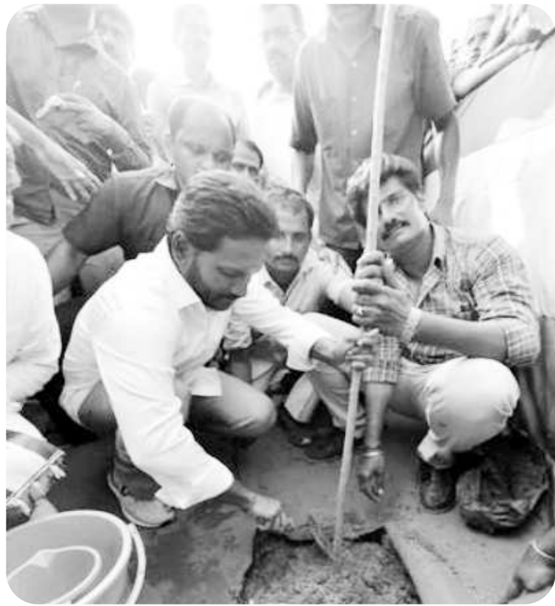
మొదటిపేజి తరువాయి :

జనం కోసం చేపట్టిన ప్రజాసంకల్పయాత్రలో సోమవారం మరో చరిత్రాత్మక ఘట్టం ఆవిష్కృతమైంది. విజయనగరం జిల్లా, ఎన్కోట నియోజకవర్గం, కొత్తవలస మండలం దేశపాత్రనిపాలెం వద్ద 3000 కిలోమీటర్ల పైలాన్‌ను జననేత వైఎస్ జగన్ ఆవిష్కరించారు. అదేవిధంగా ఈ మైలురాయికి గుర్తుగా రావి మొక్కను అక్కడ నాటారు. చారిత్రాక ఘట్టానికి సాక్షులుగా పార్టీ నాయకులు, కార్యకర్తలు, అభిమానులు భారీగా తరలివచ్చారు. దీంతో ఆ రోడ్లన్నీ జనసంద్రంగా మారాయి. జననేత పాదయాత్ర 3000 కిలోమీటర్లు చేరుకున్నవేళ తెలుగు రాష్ట్రాలతోపాటు పలు ప్రాంతాల్లో పెద్ద ఎత్తున సంఘీభావ యాత్రలు కొనసాగాయి.