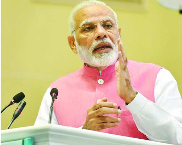
మందికి ప్రయోజనం కానీ... మొత్తంగా 14 కోట్ల మంది రైతులు పీఎం కిసాన్ స్కీమ్ బెనిఫిట్స్ పొందే అర్హత కలిగినవారు ఉన్నారని అంచనా. డిసెంబర్ 29 నాటికి కేంద్రానికి తరువాయి 2లో..

న్యూఢిల్లీ: 6 కోట్ల మంది రైతులకు గుడ్ న్యూస్! పీఎం కిసాన్ స్కీం కింద ఏడాదికి రూ.6,000 కేంద్ర ప్రభుత్వం రైతులకు పెట్టుబడి సాయంగా అందిస్తోంది. దీనిని మూడు విడతల్లో ఒక్కో విడతకు రూ.2,000 అందిస్తోంది. ప్రధాని మోడీ రైతులకు ఈ పెట్టుబడి కానుకను నూతన సంవత్సర సందర్భంగా జనవరి 2, 2020న అందించనున్నారు. జనవరి 2 దేశవ్యాప్తంగా రివేల మంది రైతుల బ్యాంకు అకౌంట్లలో డబ్బులు క్రెడిట్ కానున్నాయి. అంటే ఏరి అకౌంట్లలో రూ.12,000 కోట్లు జమ అవుతున్నాయి. కొత్త ఏడాది కానుకగా ప్రధాని సరేంద్ర మోడీ ఈ నిధులను విడుదల చేయనున్నారు. పాన్-బ్యాంకు అకౌంట్ లింక్ తప్పనిసరి.. పాన్-బ్యాంకు అకౌంట్ లింక్ తప్పనిసరి.. డిసెంబర్ 15 తేదీ నుంచి తదుపరి ఇన్స్టాల్మెంట్ అప్డేట్ రైతులకు క్రెడిట్ కాలేదు. 2019 చివరి విడత రూ.2,000 రైతులకు అందించనున్నారు. ఆధార్ కార్యక్రమం బ్యాంకు అకౌంట్ లింక్ చేసిన రైతులకు మాత్రమే పీఎం కిసాన్ నిధులు వస్తాయి. ఆరున్నర కోట్ల మంది రైతులు ఆధార్ - బ్యాంకు అకౌంట్ లింక్ చేసుకున్నారు. వీరికి ప్రయోజనం చేకూరనుంది. 14 కోట్ల మందికి ప్రయోజనం కానీ... 14 కోట్ల