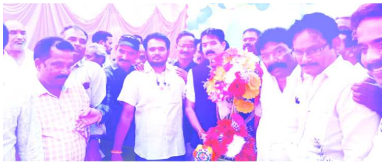
ఎమ్మెల్యే ధర్మశ్రీని అభినందిస్తున్న గోవాడ మగర్ ఫ్యాక్టరీ గుర్తింపు యూనియన్ నాయకులు శరగడం రామునాయుడు తదితరులు

- స్వయంభూ విఘ్నేశ్వరునికి భక్తులు ప్రత్యేక పూజలు - కార్యకర్తలతో కోలాహలంగా మారిన వై.ఎస్.టి.డీ కార్యాలయాలు - ఎమ్మెల్యే ధర్మశ్రీ, మాజీ ఎమ్మెల్యే కె.ఎన్.ఎస్.రాజుకు అభినందనలు