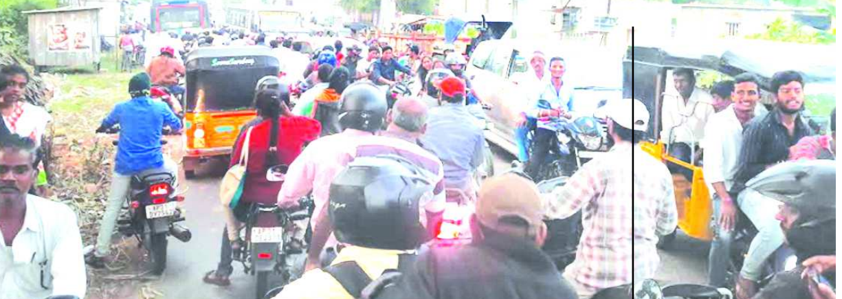
కోడవరం రోడ్డులో గజవతినగరం జంక్షన్ వద్ద భారీగా నిలచిపోయిన వాహనాలు

- 3 కిలో మీటర్లు మేర గంటల తరబడి నిలచిపోయిన వాహనాలు, - 108కు తప్పని ట్రాఫిక్ తిప్పలు - ప్రయాణికులు, వాహనదారుల అపస్థలు