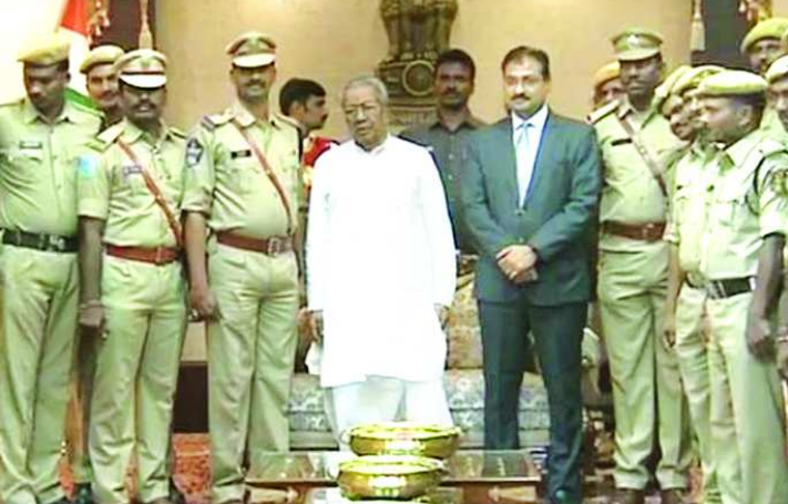
దీవెనలతో రాష్ట్రమంతటా శాంతి సామరస్యాల వెల్లివిరియాలని కోరుకుంటున్నట్లు తెలిపారు.