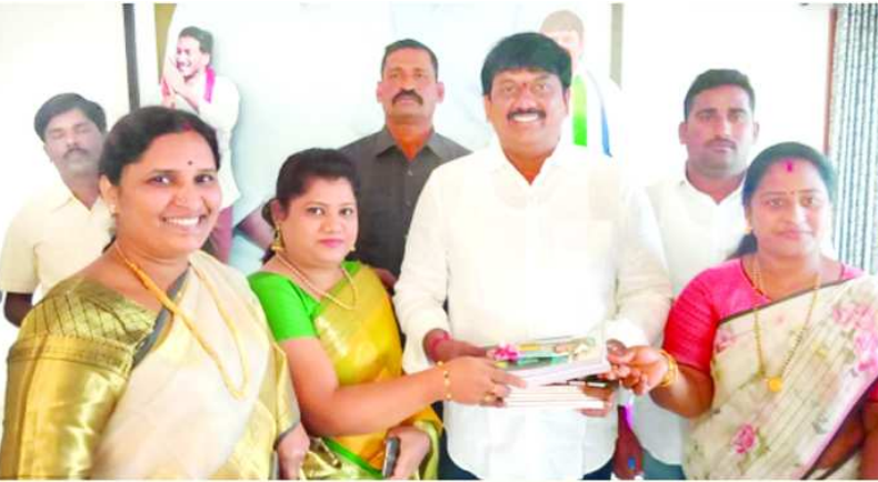
ఎమ్మెల్యేకు పుస్తకాలు అందజేసి శుభాకాంక్షలు తెలియజేస్తున్న దృశ్యం

నల్గొండలో ఘనంగా నూతన సంవత్సర వేడుకలు బుధవారం జరిగాయి. ఎమ్మెల్యే క్యాంపు కార్యాలయంలో వేడుకలు జరిగాయి. ఎమ్మెల్యే పెట్ట ఉమా శంకర్ గజేపేకు పలు వురు అధికారులు, పోలీసులు, నియోజకవర్గ వైసిపి నాయకులు, కార్యకర్తలు, వాలంటీర్లు, సచివాలయ ఉద్యోగులు వచ్చి పుస్తకాలు అందజేసి ఎమ్మెల్యేకు నూతన సంవత్సర శుభాకాంక్షలు తెలియజేశారు. మున్సిపల్ కార్యాలయంలో నూజయ్య కలు అంబరాన్ని అంటాయి. పాఠశాలలు, కళాశాలల్లో వేడుకలు జరిగాయి. మున్సిపల్ ఉద్యోగులు, వాలంటీర్లు మున్సిపల్ కమిషనర్ కృష్ణవేణికి నూతన సంవత్సర శుభాకాంక్షలు తెలియజేశారు. అదేవిధంగా పట్టణంలో వేడుకలు జరుపుకున్నారు.