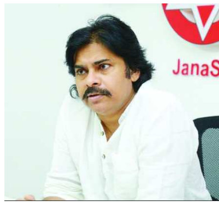
మొందుకన్నారు. ఇక ఎన్నికలు ఎందుకని ప్రశ్నించారు.

అమరావతి: స్థానిక సంస్థల ఎన్నికల్లో వైస్సీ దౌర్జన్యాలపై జనసేన అధినేత పవన్ కల్యాణ్ మండిపడ్డారు. ప్రజాస్వామ్యం పట్ల గౌరవం లేదని.. దౌర్జన్యంగా వ్యవహరిస్తున్నారని విమర్శించారు. నామినేషన్ వేయలేని పరిస్థితి తీసుకొచ్చారన్నారు. బెదిరింపులు, దాడులు చేస్తున్నారని ఆగ్రహం వ్యక్తం చేశారు. హృదయాలను గెలవలేరని చెప్పకొచ్చారు. నామినేషన్ వేసిన వాళ్లు ధైర్యంగా ఉండాలని పిలుపునిచ్చారు. దెబ్బలు తిన్నా.. బలంగా నిలబడండన్నారు. ప్రతి జనసేన, బీజేపీ అభ్యర్థి.. ధైర్యంగా ఉండి.. బెదిరింపులకు లొంగొద్దన్నారు. ప్రజాస్వామ్యాన్ని కాపాడుకోవాలన్నారు. 151 మంది సభ్యులున్న వైస్సీకి ఇంత భయం