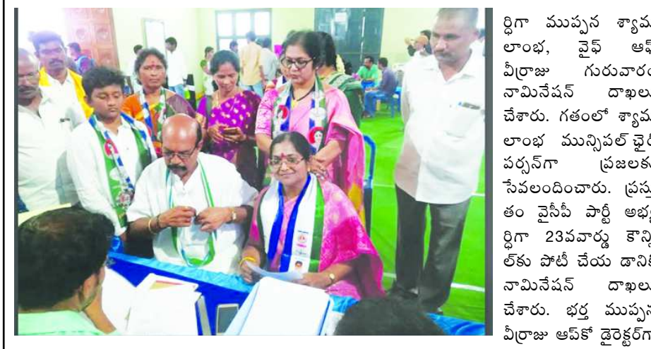
పెద్దాపురం : రానున్న మున్సిపల్ ఎన్నికలకు బాధ్యతలు వహించారు. మరియు వైయస్ఆర్ 23వ వార్డు నుండి (బిసి జనరల్) కౌన్సిలర్ అభ్యర్థి సిపిఐ లీడరుగా వున్నారు.