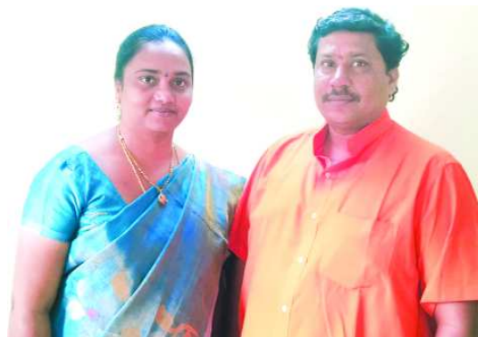
రహితంగా అన్ని వర్గాల మనిషిగా అక్కడ పేరుగానించారు. ఇది ఆయన ఎలాంటి పదవి అధికారం లేనప్పుడే తన ఉన్నత వ్యక్తిత్వంలో సంపాదించుకున్న పేరు గనుక ఈ ఎన్నికలలో అది చాలా వరకు ఉపయోగపడి ఆయన సతీమణి విజయానికి దోహదపడే అవకాశం ఉంది.