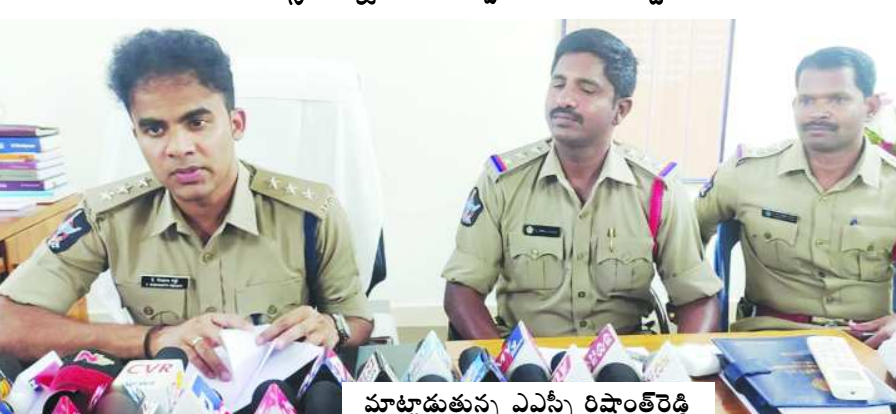
మాట్లాడుతున్న ఎంపీపీ రిషాంత్ రెడ్డి