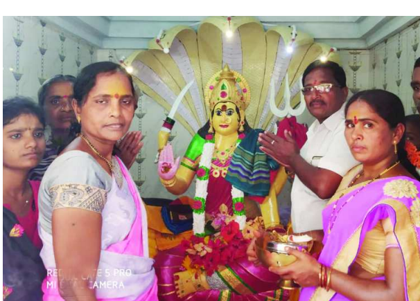
అమ్మవారి విగ్రహ ప్రతిష్ఠ, ఆలయ ప్రారంభోత్సవ కార్యక్రమం ఘనంగా జరిగింది. ఉదయం నుంచి భక్తులు అధిక సంఖ్యలో హాజరై అమ్మవారి ఆశీస్సులు పొందారు. ఈ కార్యక్రమంలో భాగంగా మధ్యాహ్నం భారీ అన్నసమారాధన కార్యక్రమం కూడా నిర్వహించడం జరుగుతుంది. ఈ కార్యక్రమం గ్రామ పెద్దలు, యువకులు అందరి సహాయ సహకారాలతో నిర్వహిస్తున్నారు. ఈ కార్యక్రమంలో గ్రామ పెద్దలు యువకులు, అధిక సంఖ్యలో భక్తులు పాల్గొన్నారు.