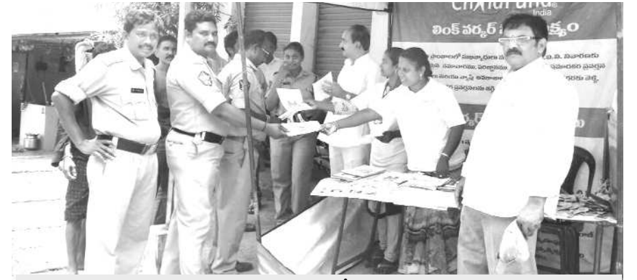
కరపత్రాలను అందజేస్తున్న దృశ్యం

నర్సేపట్నం : జిల్లా ఎయిడ్స్, నివారణ సంస్థ ఆదేశాల మేరకు నర్సేపట్నం మండలం వేములపూడి గ్రామంలో బుధవారం జరిగే సంతలో స్టాల్ ఏర్పాటు చేసిన గ్రామస్థలకు, యువకులకు సుఖవ్యాధులు, టిబి, హెచ్ఐవి, ఎయిడ్స్ సంబంధించిన కరపత్రాలను అందజేశారు. ఈ కార్యక్రమంలో సిఎల్ఓబిల్లు రూపాన్ని, క్రాంతి పై వ్యాధుల గురించి అవగాహన కల్పించారు. ఈ కార్యక్రమంలో వేములపూడి మాజీ సర్పంచ్ బోశెం ఏర్పాటు చేసిన గ్రామస్థలకు, యువకులకు సుఖవ్యాధులు, టిబి, హెచ్ఐవి, ఎయిడ్స్ సంబంధించిన కరపత్రాలను అందజేశారు. ఈ