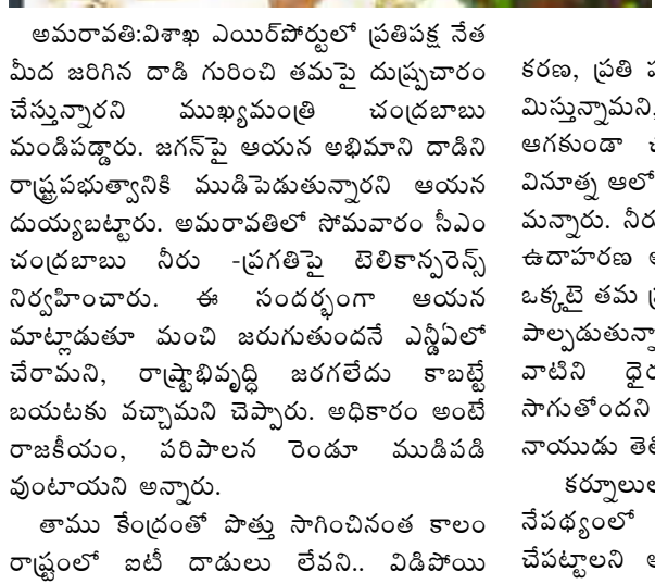
అమరావతి: విశాఖ ఎయిర్పోర్టులో ప్రతిపక్ష నేత మీద జరిగిన దాడి గురించి తమపై దుష్టచారం చేస్తున్నారని ముఖ్యమంత్రి చంద్రబాబు మండిపడ్డారు. జగన్పై ఆయన అభిమాని దాడిని రాష్ట్రపభుత్వానికి ముడిపెడుతున్నారని ఆయన దుయ్యబట్టారు. అమరావతిలో సోమవారం సీఎం చంద్రబాబు నీరు-ప్రగతిపై డెలికాన్సరెన్స్ నిర్వహించారు. ఈ సందర్భంగా ఆయన మాట్లాడుతూ మంచి జరుగుతుందనే ఎన్టీఆర్ చేరామని, రాష్ట్రాభివృద్ధి జరగలేదు కాబట్టే బయటకు వచ్చామని చెప్పారు. అధికారం అంటే రాజకీయం, పరిపాలన రెండూ ముడిపడి వుంటాయని అన్నారు. తాము కేంద్రంలో పాత్రు సాగించినంత కాలం రాష్ట్రంలో జటి దాడులు లేవని.. విడిపాటు

● జగన్ దాడిపై మాకేం సంబంధం లేదు ● సీబీఐ పరిణామాలు దేశ ప్రతిష్టతే మచ్చ ● స్వయంకృషితో అభివృద్ధి ఆగకుండా చూశాం ● ముఖ్యమంత్రి చంద్రబాబు నాయుడు