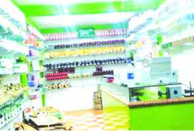
కార్యక్రమంలో కంపెనీ ప్రతినిధులు స్థానిక ప్రొడక్ట్ వినియోగదారులు తదితరులు పాల్గొన్నారు.

పాడేరు : ఆరోగ్యకరమైన నిత్యవసర వస్తువులు ఐ ఎం సి ప్రొడక్ట్ మార్కెటింగ్ విక్రయాల కేంద్రాన్ని స్థానిక సుబ్బారావు షాపింగ్ కాంప్లెక్స్ వద్ద మంగళవారం ప్రారంభించారు. ఐ ఎం సి ప్రొడక్ట్ నిత్యావసర వస్తువులు విక్రయాల కేంద్రం వద్ద వినియోగదారుల అందుబాటులో ఉంటుందన్నారు. ఐ ఎం సి వస్తువులు, ఆరోగ్యకరమైన ఆయుర్వేద ప్రొడక్ట్ ప్రతి ఒక్కరు, గృహాల్లో వాడుకోవచ్చున్నారు. ఐఎంసి ప్రొడక్టు వినియోగించటం వలన మనిషి సంపూర్ణ ఆరోగ్యంగా జీవించడానికి ఉపయోగ పడుతుంది. కేంద్రం వద్ద పలు రకాల ప్రొడక్ట్ లు అందుబాటులో ఉన్నాయన్నారు. ఐ ఎం సి పూర్తిగా ప్రకృతి ఆయుర్వేద వసమూలికలతో తయారైన ప్రొడక్టులన్నారు. ప్రొడక్టు వినియోగం వలన ఆరోగ్యదాయకం గా ఉండాలని కంపెనీ యజమానులు పేర్కొన్నారు. ఈ ప్రొడక్ట్ వినియోగం వల్ల ఎటువంటి సైడ్ ఎఫ్ఫెక్ట్ ఉండవని వారు తెలిపారు. ఈ