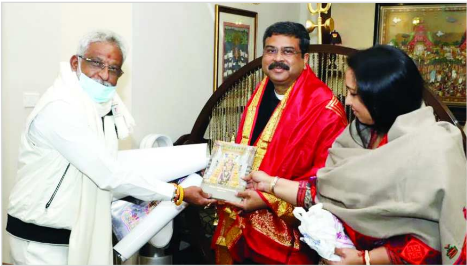
నూ్యాదిల్లీ : కేంద్ర మంత్రులు ధర్మేంద్ర ప్రధాన్, నితిన్ గడ్కరిని టీటీడీ చైర్మన్ వైవి సుబ్బారెడ్డి మంగళవారం ఢిల్లీ లో మర్యాదపూర్వకంగా కలిశారు. ఈ సందర్భంగా వారికి శ్రీవారి తీర్థ ప్రసాదాలు అందించి, డైరీ క్యాలెండర్లను అందజేస్తూ, ముందస్తుగా నూతన సంవత్సర శుభాకాంక్షలు తెలియజేశారు. టీటీడీ చేపట్టిన అనేక కార్యక్రమాల గురించి వారికి వివరించారు.

- కేంద్ర మంత్రులు ధర్మేంద్ర ప్రధాన్, నితిన్ గడ్కరి కి టీటీడీ చైర్మన్ నూతన సంవత్సర శుభాకాంక్షలు