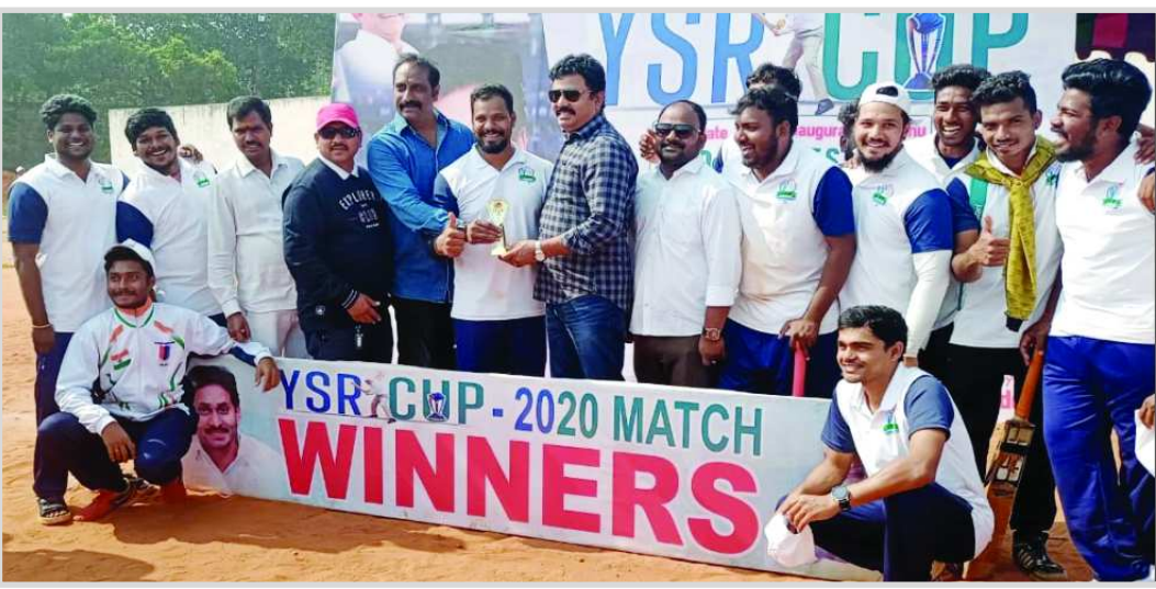
వైఎస్ఆర్ కప్ విజయం సాధించిన వారు 3లక్షల 37 వేలు