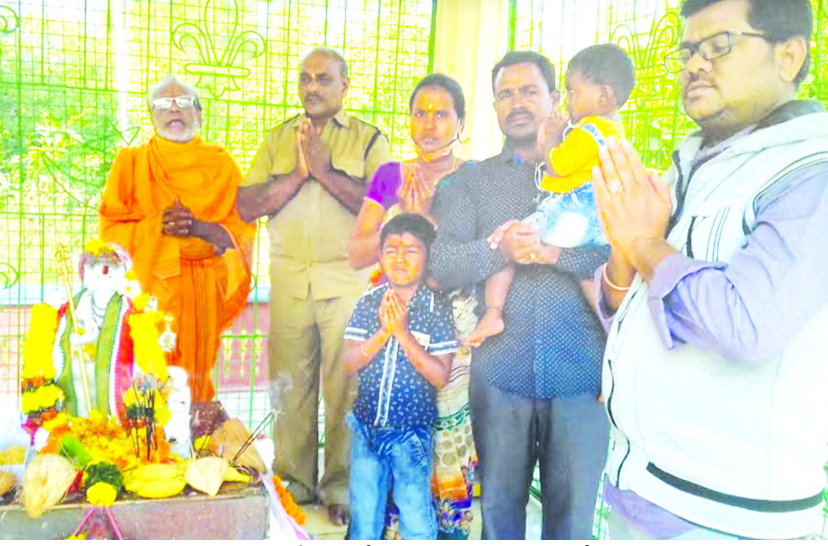
వెంకన్నపాలెం లో దత్తాత్రేయ స్వామి కి పూజలు చేస్తున్న భక్తులు