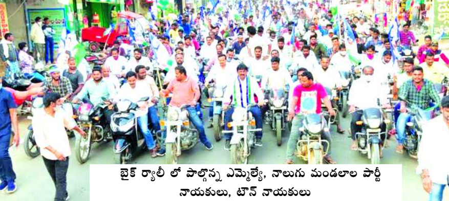
బైక్ ర్యాలీ లో పాల్గొన్న ఎమ్మెల్యే, నాలుగు మండలాల పార్టీ నాయకులు, టౌన్ నాయకులు

నర్సీపట్నం : ముఖ్యమంత్రి వైయస్ జగన్మోహన్ రెడ్డి ప్రజలకు చేస్తున్న సంక్షేమ పథకాలకు కృతజ్ఞతగా నర్సీపట్నం ఎన్నడూ లేని విధంగా సి బి ఎన్ కాంపౌండ్ సుండి పెద్ద బోర్డెపల్లి జంక్షన్ వరకు బైక్ ర్యాలీ నిర్వహించారు. మంగళవారం నిర్వహించిన ఈ ర్యాలీకి విశేష స్పందన లభించింది. నాలుగు మండలాల పార్టీ అధ్యక్షులు, ముఖ్య నాయకులు మున్సిపాలిటీ సుండి ముఖ్య నాయకులు ప్రణాళిక బద్ధంగా సమీకరణ చేసి సభను విజయవంతం చేశారు. ఎమ్మెల్యే అభీద్ సెంటర్లో అంజేద్గర్ విగ్రహం వద్ద విలేకరులతో మాట్లాడుతూ....అయ్యన్నపాత్రుడు పై తీవ్ర స్థాయిలో ధ్వజమెత్తారు కొన్ని సందర్భాల్లో