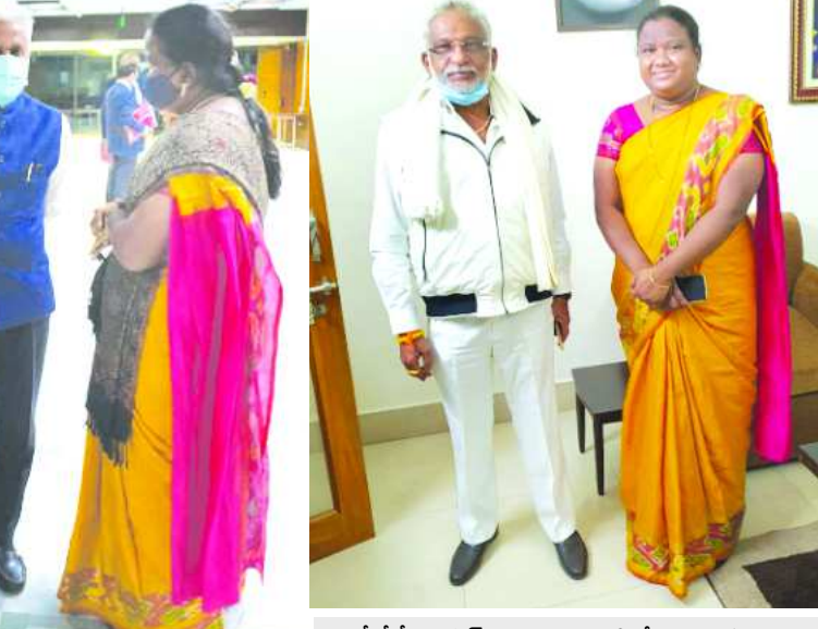
విజయసాయిరెడ్డితో ఎంపీ మాధవి

కొయ్యూరు : వైయస్సార్ కాంగ్రెస్ పార్టీ జాతీయ ప్రధాన కార్యదర్శి, రాజ్యసభ సభ్యులు విజయ సాయిరెడ్డి, టీటీడీ చైర్మన్ వై.వి.సుబ్బారెడ్డితో ఆరకు ఎంపీ గొడ్డేటి మాధవి వేర్వేరుగా భేటీ అయ్యారు. మంగళవారం ఢిల్లీలోని పార్లమెంట్ సెంట్రల్ హాల్లో మొదటిగా రాజ్యసభ సభ్యులు విజయసాయిరెడ్డితో భేటీ అయిన ఎంపీ ఆరకు పార్లమెంట్ పరిధిలోని పలు ప్రధానమైన సమస్యలపై క్లుప్తంగా చర్చించారు వీటిపై దృష్టిసారించి త్వరితగతిన పరిష్కరించాలని విజ్ఞప్తి చేశారు. అనంతరం తిరుమల తిరుపతి దేవస్థానం చైర్మన్, మాజీ పార్లమెంట్ సభ్యులు వై.వి.సుబ్బారెడ్డితో భేటీ అయి పర్యాటక రంగంలో దూసుకు వెళ్తున్న మన్య ప్రాంతానికి మరింత ప్రాముఖ్యత చేకూర్చే విధంగా తిరుమల తిరుపతి దేవస్థానం వారు ముందుకు వచ్చి పర్యాటకులను మరింత ఆకట్టుకునే విధంగా శ్రీవారి దేవాలయాన్ని, టిటిడి కళ్యాణ మండపాన్ని నిర్మించి మన్య ప్రాంతంలో కూడా శ్రీవారి ప్రత్యేక పూజలు నిర్వహిస్తూ పర్యాటకులను ఆకర్షించే విధంగా ఏర్పాటు చేసే పర్యాటక రంగంలో మన్య ప్రాంతానికి మరింత బలం చేకూర్చే విధంగా చర్యలు తీసుకోవాల్సిందిగా విజ్ఞప్తి చేశారు. దీనిపై సానుకూలంగా స్పందించిన వై.వి.సుబ్బారెడ్డి రానున్న టీటీడీ కమిటీ బోర్డు మీటింగ్లో దీనిపై చర్చించి తగు నిర్ణయం తీసుకుంటామని ఎంపీకి హామీ ఇచ్చారు.