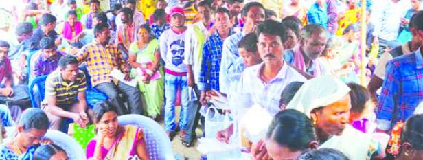
యస్సీ, యస్సీ, బీసీ, ఋణములు కొరకు ఇంటర్వ్యూలకు హాజరయిన అభ్యర్థులు