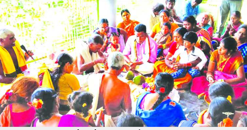
వీరబ్రహ్మాండ్రస్వామి, గోవిందమాంభల కళ్యాణ మహోత్సవం నిర్వహిస్తున్న స్థానికులు

చోడవరం : మండలంలోని అంభేరుపురం గ్రామం రాయపూజాపేట రోడ్డులో గల వీరబ్రహ్మాం గారి ఆలయంలో పోతులూరి వీరబ్రహ్మాండ్రస్వామి గోవిందమాంభ కళ్యాణ మహోత్సవం గురువారం భక్తశ్రద్ధలతో ఘనంగా నిర్వహించారు. అంభేరు పురం, గోవాడ దేవాలయ కమిటీ సభ్యులు అధ్యక్షులుగా నిర్వహించారు. ఈ కార్యక్రమంలో వీరబ్రహ్మాండ్ర విశ్వ లాహూరి సంక్షేమ సంఘం సభ్యులు, గోవాడ, అంభేరుపురం, భోకాపురం, వెంకన్నపాలెం గ్రామాలకు చెందిన భక్తులు తదితరులు పాల్గొన్నారు.