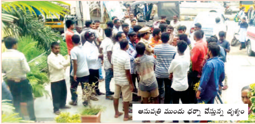
ఆసుపత్రి ముందు ధర్మా చేస్తున్న దృశ్యం

తెలిపారు. దీనికి ఆసుపత్రి వర్గాలు అంగీకరించకపోవడంతో వివాదం చెలరేగింది. క్షతగాత్రుని బంధువులు, వైకాపా పార్టీ, ప్రజాసంఘాలు ఆసుపత్రి ముందు ధర్మాకు దిగాయి. ఎలమంచిలి, అనకాపల్లి ప్రాంతాల నుంచి క్షతగాత్రుని బంధువులు, వివిధ రాజకీయపార్టీలు, ప్రజాసంఘాలు రంగప్రవేశం చేయడంతో ఆసుపత్రి వద్ద ఉద్రిక్త పరిస్థితులు నెలకొన్నాయి. క్షతగాత్రుడు ఆసుపత్రిలో చేరిన దగ్గర నుంచి ఇంజనీరింగ్ యూనిట్లో ఉన్నాడని కనీసం చూడనివ్వలేదని కుటుంబీకులు ఆరోపణలు చేయడంతో అసలు క్షతగాత్రుడు బ్రతకే ఉన్నాడా? లేక తాకూర్ సిసీమా సన్నివేశాలు ఇక్కడ జరుగుతున్నాయా? అనే సందేహాలు అంతటా నెలకొన్నాయి. పరిస్థితి ఉద్రిక్తంగా మారడంతో పోలీసులు రంగప్రవేశం చేసి ఇరు వర్గాలకు స్థిరచెప్పారు. అలాగే గతంలో ఇలాగే మునగపాక మండలం, తోటాడ గ్రామానికి చెందిన ఇద్దరు యువకులు ప్రమాదంలో తీవ్రంగా గాయపడడంతో ఇదే ఆసుపత్రిలో చేర్చారు. ఇంచుమించుగా ఇవే సన్నివేశాలు చోటుచేసుకోవడంతో మొత్తం ఆ గ్రామం అంతా తరలివచ్చి ఆసుపత్రి ముందు ధర్మాకు దిగింది. ఇటువంటి సన్నివేశాలు తరచూ ఇక్కడ జరుగుతున్నా ఉంటాయి.