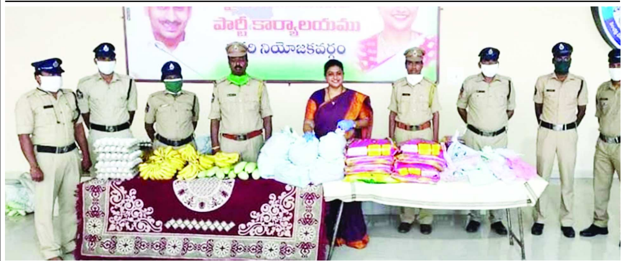
నగరి ఎమ్మెల్యే కార్యాలయం నందు నగరి, పుత్తూరు ఎమ్మెల్యే అండ్ ప్రొహిబిషన్ శాఖ ఉద్యోగులు 27 మందికి నిత్యవసర వస్తువులైన వియ్యం 10 కిలోలు, కందిపప్పు ఒక కిలో, నూనె ఒక లీటరు, కోడిగుడ్డు 30, అరటి పండ్లు ఒక డజను. కూరగాయలు 5 రకాలు మరియు సొరకాయ మొదలైనవి ఎమ్మెల్యే ఆర్డర్ రోజు అందజేశారు.