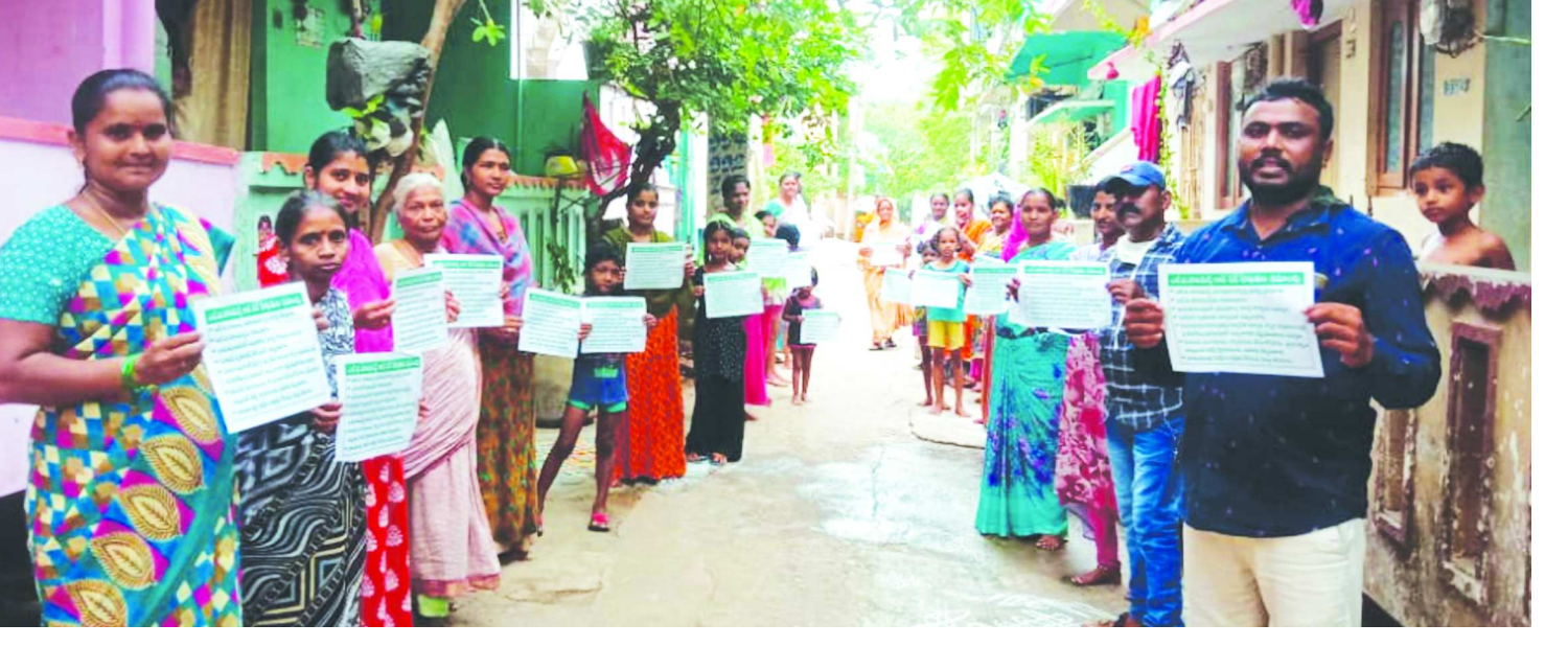
వైరెక్టర్లకు తరుమాకలవటం, మెమోరాండం పేర కంపెనీకి అనుకూలంగా వ్యవహరిస్తూ బాధిత ప్రజల్లో, వీటిలకు తీసుకురావటానికి ప్రయత్నం చేస్తున్నారని అన్నారు. వీటిని యాజమాన్యం దక్షిణ కొరియాలో తమకి అనుకూలంగా ప్రచారం చేసుకుంటుందని గంగారావు అన్నారు.