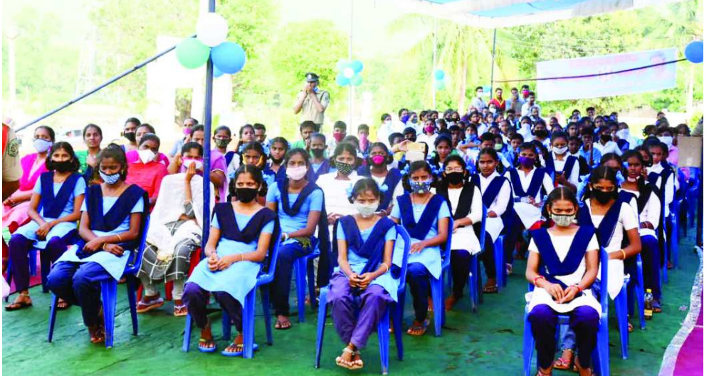
ఖర్చును 10 లక్షలరూపాయల నుండి 15 లక్షలకు పెంచి మంజూరు చేయడమైనదని తెలిపారు.

2023 సంవత్సరానికి జిల్లాలో మొత్తం పాఠశాలలకు నాడు-నేడు కార్యక్రమం ద్వారా మౌళిక సదుపాయాలు కల్పిస్తామని తెలిపారు. అదే విధంగా త్వరలో అంగన్వాడి సెంటర్లను పి డ్రైమర్ సిస్టాంట్ల సూక్ష్మాగా మార్చువేసి 3-6 సంవత్సరాల పిల్లలకు విద్యనందించనున్నట్లు తెలిపారు. అందుకుగాను అంగన్వాడి సెంటరు నిర్మాణానికి ఆయ్యే