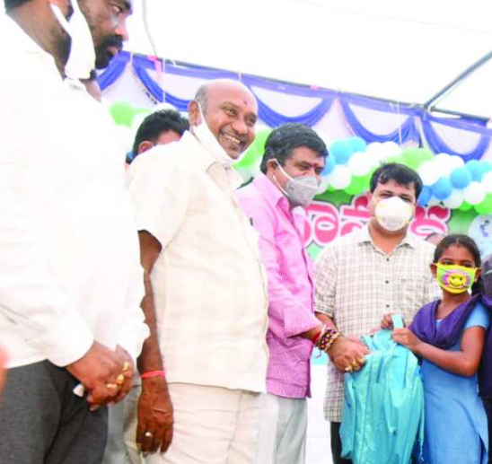
ప్రభుత్వం విద్యార్థులకు అనేక పథకాలు ప్రవేశ పెట్టిందని తెలిపారు. జగనన్న విద్యాకానుక పలన విద్యార్థుల ఆత్మ విశ్వాసం పెరుగుతందని తెలిపారు.

రైతు రూ.67.62 చెల్లించాలని కలెక్టర్ నివాసి చెప్పారు. పెసలు ఐపియం 2-14 రకం పూర్తి ధర రకం రూ.106.52 కాగా రూ.31.96 రాయిత్ ఇవ్వడం జరుగుతుందని, రైతు రూ.74.56 చెల్లించాలని కలెక్టర్ చెప్పారు. రాగి క్రిస్టెన్స్ రకం పూర్తి ధర రకం రూ.63.91 కాగా రూ.31.96 రాయిత్ ఇవ్వడం జరుగుతుందని, రైతు రూ.31.95 చెల్లించాలని అన్నారు.వేరు శనగ 36 రకం పూర్తి ధర రకం రూ.78.50 కాగా రూ.31.40 రాయిత్ ఇవ్వడం జరుగుతుందని, రైతు రూ.47.10 చెల్లించాలని చెప్పారు.రైతులు తమకు కావలసిన విత్తనాలు కొరకు గ్రామ రైతు భరోసా కేంద్రంలో గ్రామ వ్యవసాయ సహాయకులను (వి.వి.వి)ను సంప్రదించి డి.క్రిమ్ యాస్ లో తమ పేరును నమోదు చేయించుకోవాలని ఆయన సూచించారు. విత్తన ధర చెల్లించి నేరుగా ఆర్.బి.కె ల నుండి విత్తనాలను పొందాలని ఆయన కోరారు. రబీ కాలమునకు అవసరమైన విత్తనాలు కూడా ఏపీసిడ్స్ సంస్థ సిద్ధం చేసారని అన్నారు.