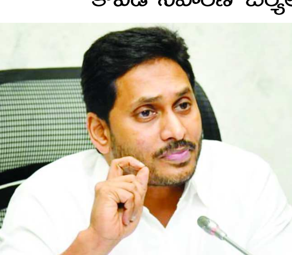
తాడేపల్లి : ఆరోగ్యశ్రీ ఆసుపత్రిలో ఆరోగ్యమిత్రులను తప్పనిసరిగా నియమించాలని ముఖ్యమంత్రి వైఎస్ జగన్మోహన్ రెడ్డి ఆదేశించారు. ఆసుపత్రిలో వైద్య సేవలు, సదుపా