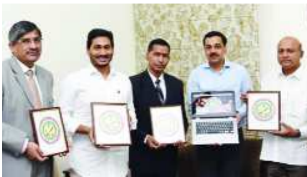
ఏపీ జ్యుడిషియల్ ప్రివ్యూ కమిటీ వెబ్సైట్ ఆవిష్కరణ ఆంధ్రప్రదేశ్ జ్యుడిషియల్ ప్రివ్యూ కమిటీ వెబ్సైట్ను