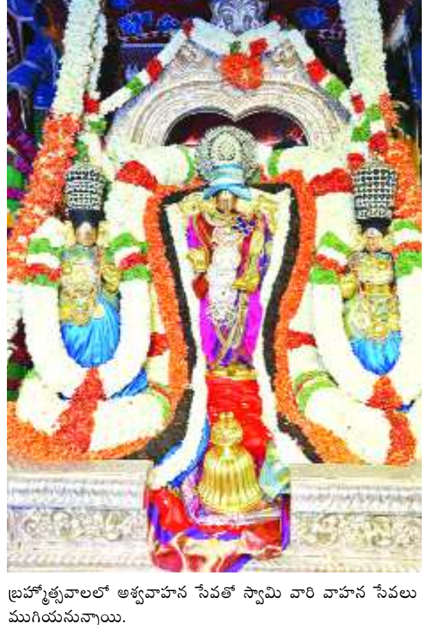
బ్రహ్మోత్సవాలలో అశ్వవాహన సేవతో స్వామి వారి వాహన సేవలు ముగియనున్నాయి.