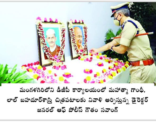
మంగళగిరిలోని డిజిబీ కార్యాలయంలో మహాత్మా గాంధీ, లాల్ బహదూర్ శాస్త్రి చిత్రపటాలకు నివాళి అర్పిస్తున్న డైరెక్టర్ జనరల్ ఆఫ్ పోలీస్ గౌతం సవాంగ్