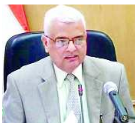
దిల్లీ: తెలంగాణలో పాటు ఐదు రాష్ట్రాల్లో ఎన్నికల నగారా మోగింది. రాజస్థాన్, మధ్య ప్రదేశ్, ఛత్తీస్ గఢ్, మిజోరాంలలో పాటే

తెలంగాణలోనూ ఎన్నికలు నిర్వహించాలని కేంద్ర ఎన్నికల సంఘం నిర్ణయించింది. ఈ మేరకు కేంద్ర ఎన్నికల ప్రధాన కమిషనర్ ఓపి రావత్ ఎన్నికల షెడ్యూల్ ను విడుదల చేశారు. తెలంగాణలో ఎన్నికల పోలింగ్ డిసెంబర్ 7న మొత్తం 119 స్థానాలకు ఒకే విధతలో నిర్వహించనున్నట్లు వెల్లడించారు. డిసెంబర్ 11న ఫలితాలు వెల్లడిస్తామని స్పష్టం చేశారు. నవంబర్ 12న ఎన్నికలకు నోటిఫికేషన్ జారీ చేయనున్నట్లు చెప్పారు. ముఖ్యమైన తేదీలు.. తెలంగాణలో నామినేషన్లకు తుది గడువు: నవంబర్ 19, నామినేషన్ల ఉపసంహరణ గడువు: నవంబర్ 22, నామినేషన్ల పరిశీలన: నవంబర్ 28 పోలింగ్ తేదీ: డిసెంబర్ 7 [తరువాతి పేజీ..]