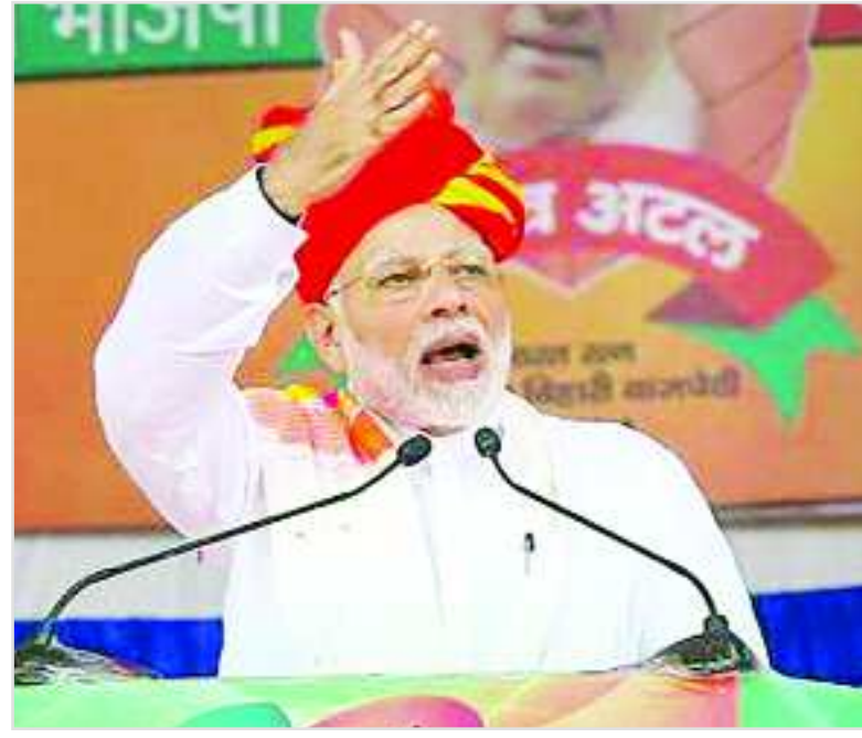
అక్షేరలో కాంగ్రెస్ పార్టీని చెత్త రాజకీయాలని ప్రధాని నరేంద్ర మోదీ తీవ్ర స్థాయిలో విమర్శించారు. శనివారం రాజస్థాన్ లోని అక్షేరలో ఎన్నికల ప్రచార సభలో పాల్గొన్న మోదీ కాంగ్రెస్ ని ఓటు

బ్యాంకు రాజకీయాలని, మెరుపుదాడులపై కూడా వారు రాజకీయాలు చేసి సైనికులను ఆపమానించారని ధ్వజమెత్తారు. అనవసర భయాలు, అసమానాలు సృష్టించే వారిని దూరంగా ఉంచాలని అన్నారు. అలాంటి వాళ్లు హామీలు ఇంటి మీ భయాలు, సందేహాలతో ఆడుకుంటారని.. అలాంటి మనుషులు, పార్టీల పట్ల జాగ్రత్తగా ఉండాలని పేర్కొన్నారు. కాంగ్రెస్ అబద్ధాలు చెప్పే.. భయాలు సృష్టించారని అన్నారు. వారి హయాంలో జరిగిన అభివృద్ధి, మా హయాంలో జరిగిన అభివృద్ధిని పోలుస్తూ చర్చ జరుపుదాం రమ్మని అహ్వనిస్తే.. అలాంటి చర్చకు దూరంగా పారిపోతున్నారని మోదీ ఆరోపించారు. తాము సబ్ కా సాత్ సబ్ కా వికాస్ కోసం ప్రయత్నిస్తుంటే కాంగ్రెస్ సమాజాన్ని విడదీస్తోందని ఆరోపించారు.