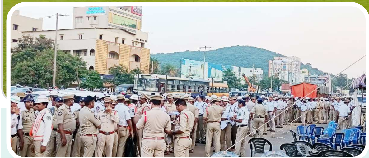
నోచేబెల్లో అతిద్వం అందించేవారు. క్రీడాకారులు పి ఎం పాలెం స్టేడియం కి చేరుకునే సమయం లో ట్రాఫిక్ అవాంత

మధురవాడ (విజయభాను న్యూస్) : భారత్ - దక్షిణాఫ్రికా జట్టు మధ్య నేటి సాయంత్రం జరగనున్న 3 వ టి -20 మ్యాచ్ కి పి ఎం పాలెం ఏసీఏ- విడిసివి క్రికెట్ స్టేడియం సర్వం సిద్ధమైంది. స్టేడియం లోపల 730 మంది లా అండ్ ఆర్డర్ పోలీసులను, స్టేడియం బయట 500 మంది ట్రాఫిక్ పోలీసుల నిబ్బందినీ, ఇతర తనిఖీ విభాగాలు కలుపుకొని మొత్తం 1430 మంది పోలీసులతో కట్టు దిట్టమైన భద్రతను ఏర్పాటు చేశామని అధికారులు పేర్కొన్నారు. ప్రేక్షకులు స్టేడియంలోనికి ప్రవేశించేందుకు గాను స్టేడియం చుట్టూ 20 గేట్లను ఏర్పాటు చేశామని తెలిపారు. సాయంత్రం 7 గంటలకు మొదలై రాత్రి 11:30 గంటల వరకు జరుగుతుందని అన్నారు. 27 వెలు మంది సామర్వ్యం కలిగిన స్టేడియం లో ప్రేక్షకులకు కావలసిన సౌకర్యాలు కల్పించమని అన్నారు. ఇదిలా ఉండగా స్టేడియం లోపలికి ఏటువంటి తినుబండారాలు, వాటర్ బాటిల్స్, జెండాకర్రాలను అనుమతించేది లేదని పోలీసులు స్పష్టంచేశారు. ఇరు జట్టు సోమవారం సాయంత్రానికి నగరానికి చేరుకున్నాయి.నగరంలో ఎప్పుడు క్రికెట్ జరిగిన క్రీడాకారులకు