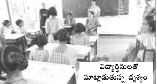
విద్యార్థులతో మాట్లాడుతున్న దృశ్యం