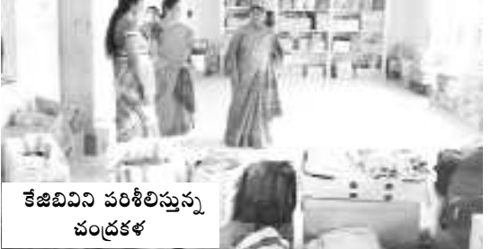
కేజిబివ పరిశీలిస్తున్న చంద్రకళ