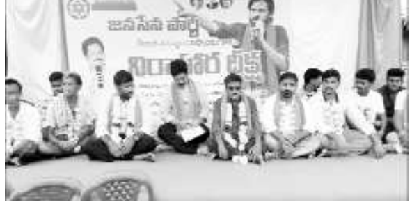
14కిలో మీటర్ల రోడ్డు శిథిలమైందన్నారు. పంచాయతీ గల 17 గ్రామాలకు రక్షిత మంచినీరు, రోడ్డు, నిర్మాణ, వైద్యంతో పాటు ఉపాధి అవకాశం కల్పించాలన్నారు. జలాశయం పరివాహక ప్రాంతంలో ఉన్న గ్రానైట్ క్వారీలు వెంటనే రద్దు చేయాలన్నారు. సమస్యలను పరిష్కరించకపోతే ఉద్యమాన్ని తీవ్రతరం చేస్తామని ఆయన హెచ్చరించారు. ఈ కార్యక్రమంలో పలువురు గిరిజనులు, జనసేన నాయకులు పాల్గొన్నారు.