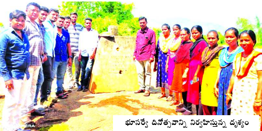
భూసర్వే దినోత్సవాన్ని నిర్వహిస్తున్న దృశ్యం