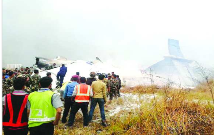
కాల్మాండా: నేపాల్ రాజధాని కాల్మాండాలో ఘోర ప్రమాదం చోటుచేసుకుంది. బంగ్లాదేశ్ తరువాయి 2లో