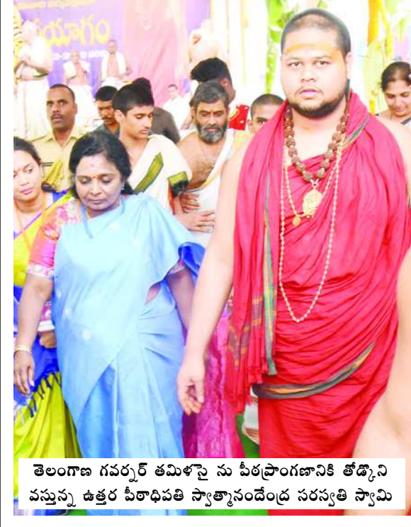
తెలంగాణ గవర్నర్ తమిళ సై ను పీఠప్రాంగణానికి తోడ్కొని వస్తున్న ఉత్తర పీఠాధిపతి స్వాత్మానందేంద్ర సరస్వతి స్వామి