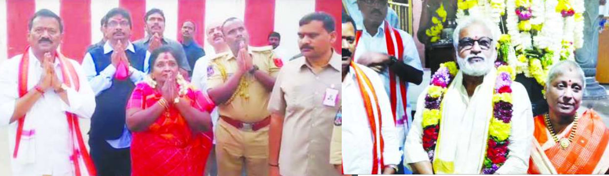
అప్పన్న సేవలో తెలంగాణ గవర్నర్ తమిళ సై మరియు టీటీడీ చైర్మన్ వై వి సుబ్బారెడ్డి