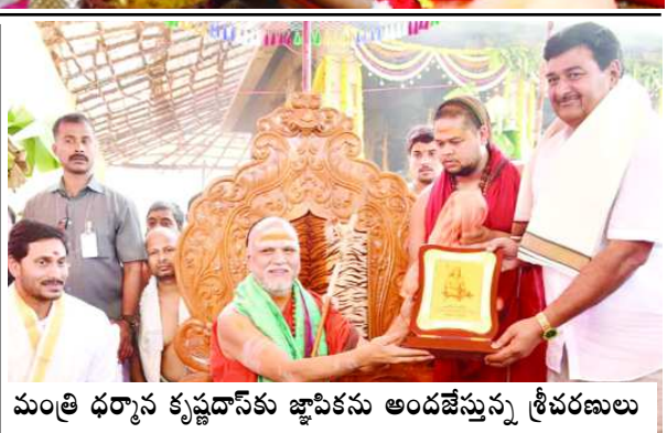
మంత్రి ధర్మాని కృష్ణదాస్ కు జ్ఞాపికను అందజేస్తున్న శ్రీచరణులు