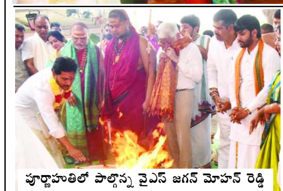
పూర్ణాహతిలో పాల్గొన్న వైఎస్ జగన్ మోహన్ రెడ్డి