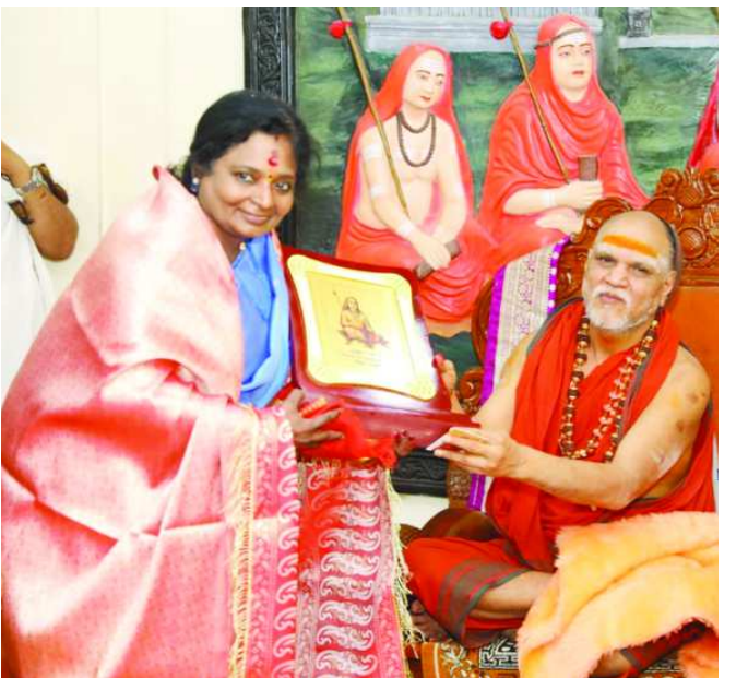
శ్రీచరణులు ఆశీస్సులు అందుకున్న అనంతరం తెలంగాణ గవర్నర్ తమిళ సై కు జ్ఞాపికను అందజేస్తున్న మహాస్వామి వారు.