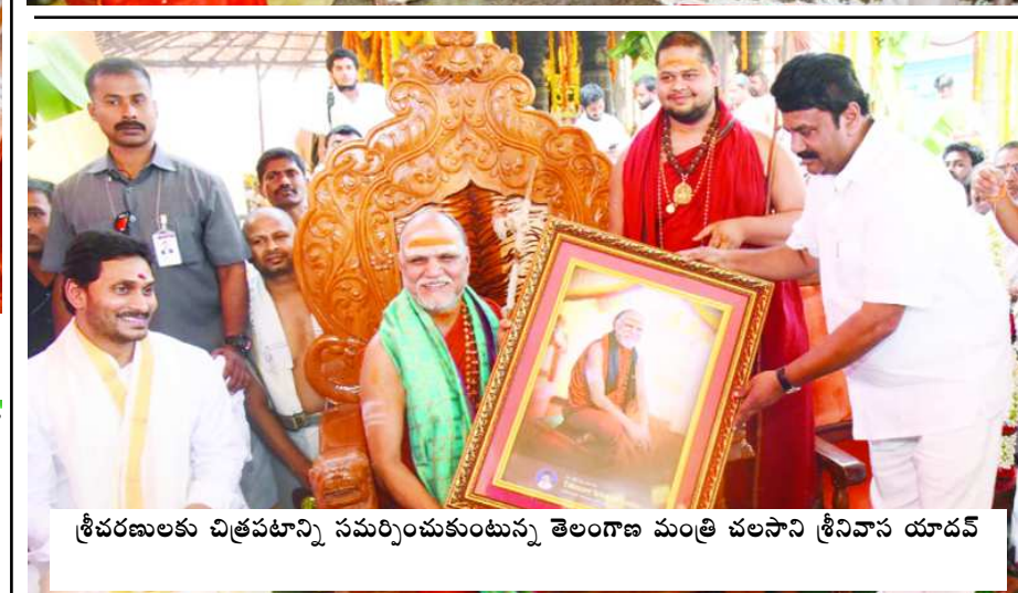
శ్రీచరణులు చిత్రపటాన్ని సమర్పించుకుంటున్న తెలంగాణ మంత్రి చలసాని శ్రీనివాస్ యాదవ్