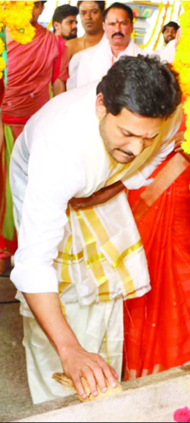
శ్రీనివాస చతుర్వేద హవనం పూర్ణాహతిలో పాల్గొన్న ఏపీ సీఎం వైఎస్ జగన్ మోహన్ రెడ్డి, టీటీడీ చైర్మన్ వైవీ సుబ్బారెడ్డి దంపతులు.