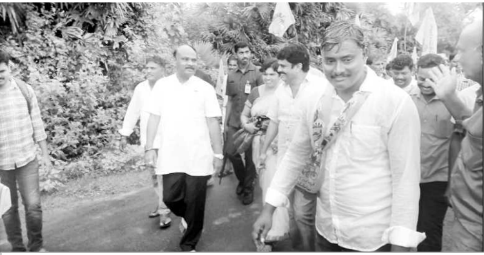
గ్రామంలో పర్యటిస్తున్న మంత్రి అయ్యన్న