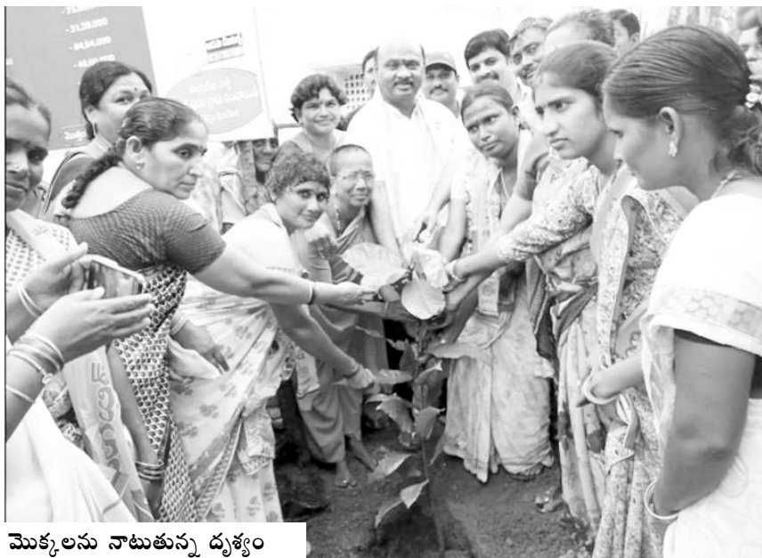
మొక్కలను నాటుతున్న దృశ్యం

నర్సపట్నం : ఓఎల్పురం పంచాయతీలో అభివృద్ధికి రూ.4 కోట్ల ఖర్చు చేసినట్లు రాష్ట్ర రోడ్డు భవనాలశాఖ మంత్రి చింతకాయల అయ్యన్నపాత్రుడు అన్నారు. గురువారం నర్సపట్నం మండలం ఓఎల్పురం పంచాయతీ కెఎల్పురం గ్రామంలో గ్రామదర్శిని, గ్రామ వికాసం కార్యక్రమాల నిర్వహించారు. ముందుగా ఆయన గ్రామంలో మొక్కలు నాటారు. అనంతరం జరిగిన సభలో మంత్రి అయ్యన్నపాత్రుడు మాట్లాడుతూ గ్రామంలో ఏమైనా సమస్యలు ఉంటే నా దృష్టికి తీసుకురావాలని చెప్పారు. ప్రభుత్వం చేస్తున్న కార్యక్రమాలను ఆలోచించాల్సిన అవసరం ఉందన్నారు. ఈ గ్రామంలో 17 సిమెంటు రోడ్లు వేయడమైందని, ఫింఛనులు 209 మందికి పంపిణీ చేయడం జరుగుతుందని అన్నారు. రాష్ట్రంలో 13వేల గ్రామాలు ఉండగా 55 లక్షల మందికి ఫింఛనులు ప్రభుత్వం ఇస్తుందని తెలిపారు. ఒంటరి మహిళలకు ఫింఛనులు మంజూరు చేయడం జరిగిందన్నారు. ఇంటిలో పెద్ద మనిషి ప్రమాదపాత్రుడు మరణిస్తే ఆ కుటుంబంను ఆదుకోవడానికి చంద్రన్న భీమా పథకం ముఖ్య మంత్రి ప్రవేశ పెట్టారని, దీనికి రూ. 15 బిమా చెల్లిస్తే ప్రభుత్వం నుండి రూ.5 లక్షలు, అలాగే పార్టీ సభ్యత్వం ఉంటే మరో రూ.2.లక్షలు అందుతుందన్నారు. గృహాలకు రూ.1.50లక్షలు ప్రభుత్వం ఇస్తుందన్నారు. ఈ డబ్బును తిరిగి చెల్లించే అవసరంలేదని తెలిపారు. నర్సపట్నంలో సుమారు 7 వేల గృహాలు మంజూరు చేయడం జరిగిందన్నారు. రాష్ట్రంలో 18 వేల కిలోమీటర్ల రోడ్లను వేయడమైందన్నారు. చంద్రన్న పెళ్లి కానుక కు పెళ్లి రోజుకు 15 రోజులు ముందుగానే దరఖాస్తు చేసుకోవా