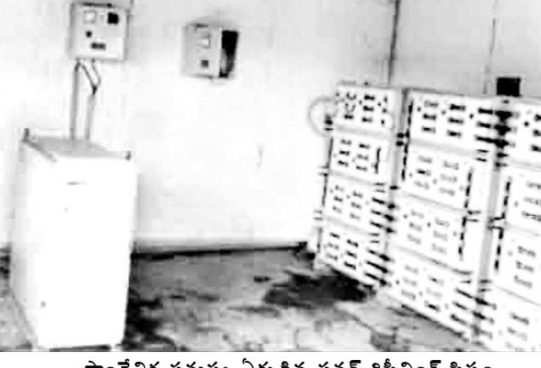
సాంకేతిక సమస్య ఏర్పడిన పవర్ రిసీవింగ్ సిస్టం

పిడుగుపాటుకు మరమ్మత్తులకు గురైన సోలార్ సిస్టం