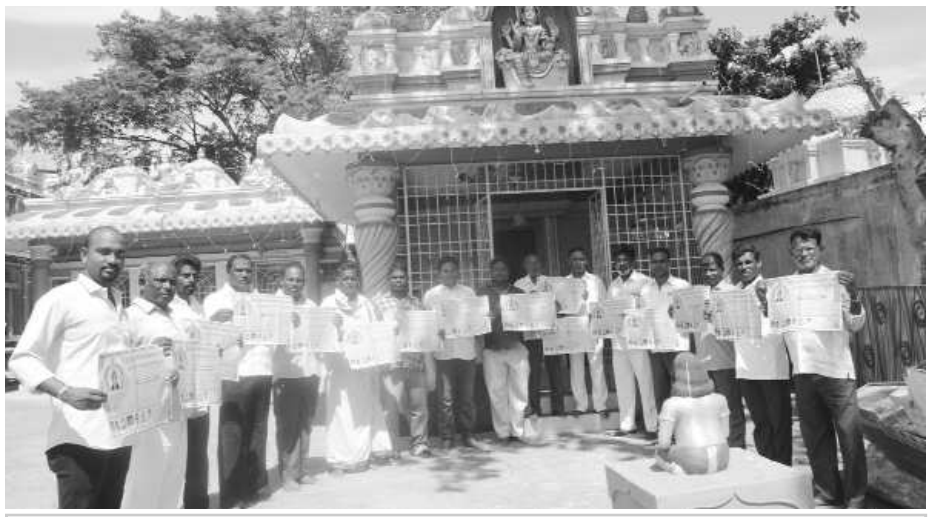
గోడవతిక విడుదలచేస్తున్న పెదజాలరిపేట కాలనీ పెద్దలు

విశాఖపట్నం : స్థానిక పెదజాలరిపేటలో గల రమణముత్యాలమ్మవారి ఉత్సవాలు మంగళ వారం ఘనంగా ప్రారంభమయ్యాయి. ఈ మేరకు ఇక్కడి సదసుపుట్ట వద్ద అమ్మవారి ఉత్సవాల గోడవతికను మంగళవారం కాలనీ పెద్దలు విడుదలచేశారు. ఈ సందర్భంగా వారు మాట్లాడుతూ అమ్మవారి తొలెళ్ళు ఈ నెల 24వ తేదీన, అనువు ఉత్సవం 25 వ తేదీన జరుగుతా యన్నారు. అనువురోజు సాయంత్రం 6 గంట లకు సదసుపుట్ట నుంచి ప్రారంభమై ఊరేగింపు ఊడా పార్కు, మానసిక ఆసుపత్రి, పెదవాలేరు ప్రాంతాలమీదుగా సాగుతుందన్నారు. ఈ సందర్భంగా 41 అడుగుల అమ్మవారి బొమ్మ ఊరేగింపు జరుగుతుందని తెలిపారు. 25