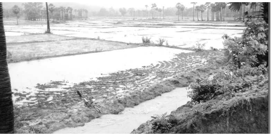
వర్షాలెరుపుకు మడుం నిర్మాణం వీలుగా గట్టు తవ్విన ప్రదేశం ద్వారా వరద నీరు వెళుతున్న దృశ్యం

కొయ్యూరు : యు.పీడిపాలెం పరిధిలో నీరు చెట్టు పథకంలో మరమ్మత్తులు చేపట్టిన రెండు చెరువులు ఇటీవల కురిసిన వర్షాలకు చేరిన వరదనీటికి గండి పడి సుమారు 200 ఎకరాల పైబడి వరినాట్లకు సిద్దమైన నారుమడులు నీట మునిగాయి. వివరాల్లోకి వెళ్తే యు.పీడిపాలెం గ్రామానికి ఆనుకొని పంచాయతీ కార్యాలయం పక్కనే ఉన్న పల్లాల చెర్వు, పల్లాలవీధికి ఆనుకొని ఉన్న ఎర్రచెరువు గత మూడు రోజులుగా కురుస్తున్న భారీ వర్షాలకు ఎర్రగొండ, ఉల్లిగుంట, కంపుమానుపాకల మీదుగా వచ్చే కొండవారు ప్రవాహాల ద్వారా చేరిన వరదనీటికి నీట