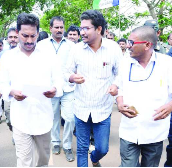
పక్కా గృహాలను నిర్మిస్తానని జగన్ తెలిపారు. ఒక కమిటీని ఏర్పాటు చేసి ప్రత్యేక చట్టం ఏర్పాటుకు చర్యలు తీసుకుంటానని హామీ ఇచ్చారు.