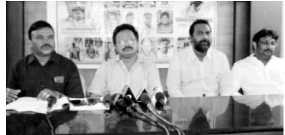
విశాఖపట్నం: క్రీడా ప్రపంచంలో దివ్యాంగులను భాగస్వాములను చేస్తూ ప్రోత్సహించేందుకు విశాఖలో