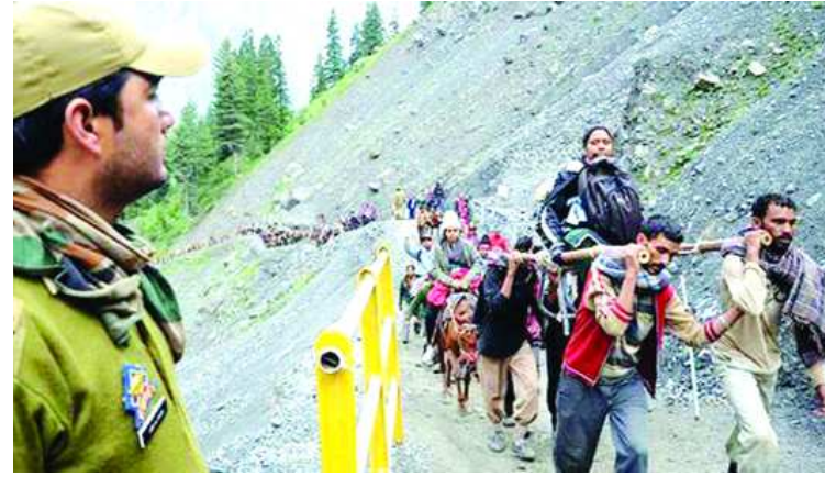
అధికారి ఒకరు మీడియాకు వెళ్లడం వల్ల అంతేగాక.. కశ్మీర్ కు చెందిన కొందరు యువకులు పాకిస్థాన్ వెళ్లి అక్కడ 2 నుంచి 4 నెలల పాటు ఉగ్రవాదుల శిబిరంలో శిక్షణ తీసుకుంటున్నట్లు సదరు వర్గాలు పేర్కొంటున్నాయి. తిరిగి వచ్చి కశ్మీర్ లోని ఉగ్రవాద బృందాల్లో చేరుతున్నట్లు తెలిపారు.