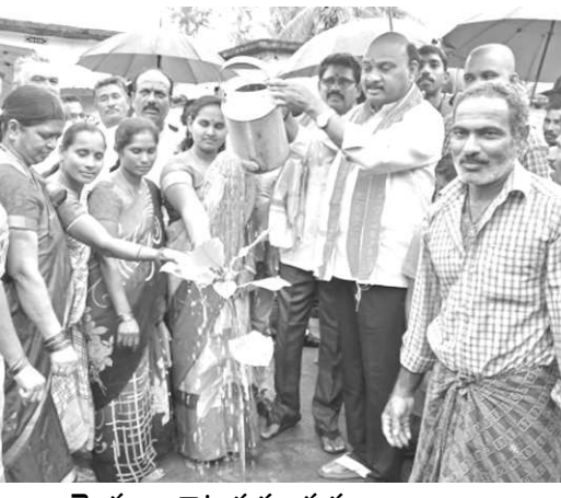
మొక్కలు నాటుతున్న దృశ్యం