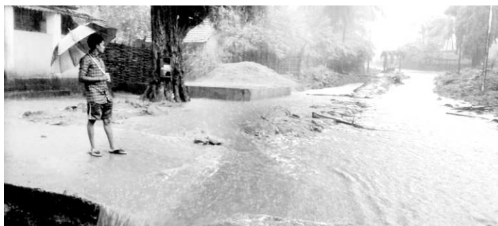
మురుగునీటి వీధి కాలువల నిర్మాణాలకు తప్పిన కాలువల నుండి పొంగి ప్రపంచాన్ని వరదనీరు

కొయ్యూరు : యు.పీ.డి.పాలెం గ్రామంలో వీధి కాలువల ఏర్పాటు గత కొన్ని మాసాలుగా అసంపూర్ణంగా నిలిపి వేయడంతో ఇటీవల కురుస్తున్న వర్షాలకు కొండవాలు నుంచి వచ్చే వరదనీరు కాలువలోకి చేరి పొంగి ప్రపంచాన్నిండటంతో గ్రామం జలదిగ్భం ధమ్మెంది. యు.పీ.డి.పాలెం గ్రామంలో వీధి కాలువల నిర్మాణాలకు తీసిన కాలువల గ్రామస్థుల పాలిటా శాపంగా మారింది. గ్రామంలో వాడుక నీరు ఊరి బయటకు తరలిం చేయడం వీలుగా మురుగునీటి కాలువలు నిర్మాణాలు పంచాయతీ