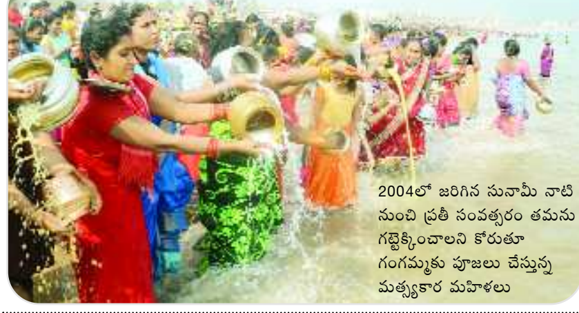
2004లో జరిగిన సుమామీ వాటి నుంచి ప్రతి సంవత్సరం తమను గడ్డెక్కించాలని కోరుతూ గంగమ్మకు పూజలు చేస్తున్న మత్స్యకార మహిళలు

మెల్ బోర్న్ లో రాణించిన మయాంక్, పుజారా, కోహ్లా మెల్ బోర్న్: ఆస్ట్రేలియాలో మెల్ బోర్న్ వేదికగా జరుగుతున్న బాక్సింగ్ 25 దెస్సు తొలి రోజు ఆట ముగిసింది. రెండు వికెట్ల నష్టానికి టీమిండియా 115 పరుగులు చేసింది. ఓపెనర్ మయాంక్ అగర్వాల్ (76), పుజారా (68) అర్ధశతకాలు సాధించారు. మ్యాచ్ ఆరంభంలోనే టీమిండియా తొలి వికెట్ చెజార్చుకుంది. ఆ తర్వాత మయాంక్ - పుజారా జోడీ రెండో వికెట్ కు 79 పరుగుల కీలక భాగస్వామ్యం నెలకొల్పింది. మయాంక్ ఔటైన తర్వాత క్రీజులోకి వచ్చిన కోహ్లా (47) పుజారాతో కలిసి దూకుడుగా ఆడాడు. వీరెడ్లూ ఆటముగిసే సమయానికి 92 పరుగులు జోడించి క్రీజులో ఉన్నారు.