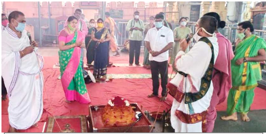
శ్రావణ మాసం సందర్భంగా బుధవారం శ్రీ కనక మహాలక్ష్మి అమ్మవారి దేవస్థానం లో 16 మంది పాస్తర్ ద్వారా జరిగిన కుంకుమార్చన లో ప్రత్యక్షంగా 15 మంది పాల్గొనుట జరిగింది.