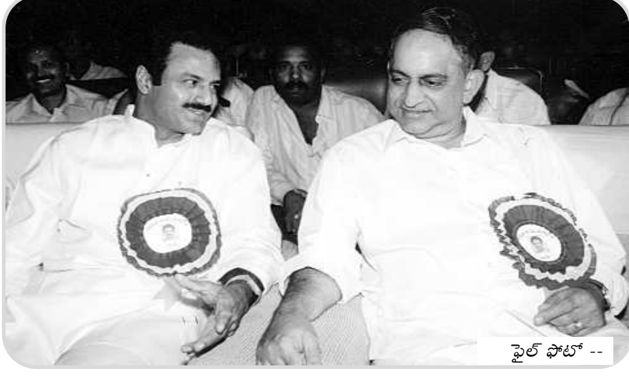
ఫైల్ ఫోటో --