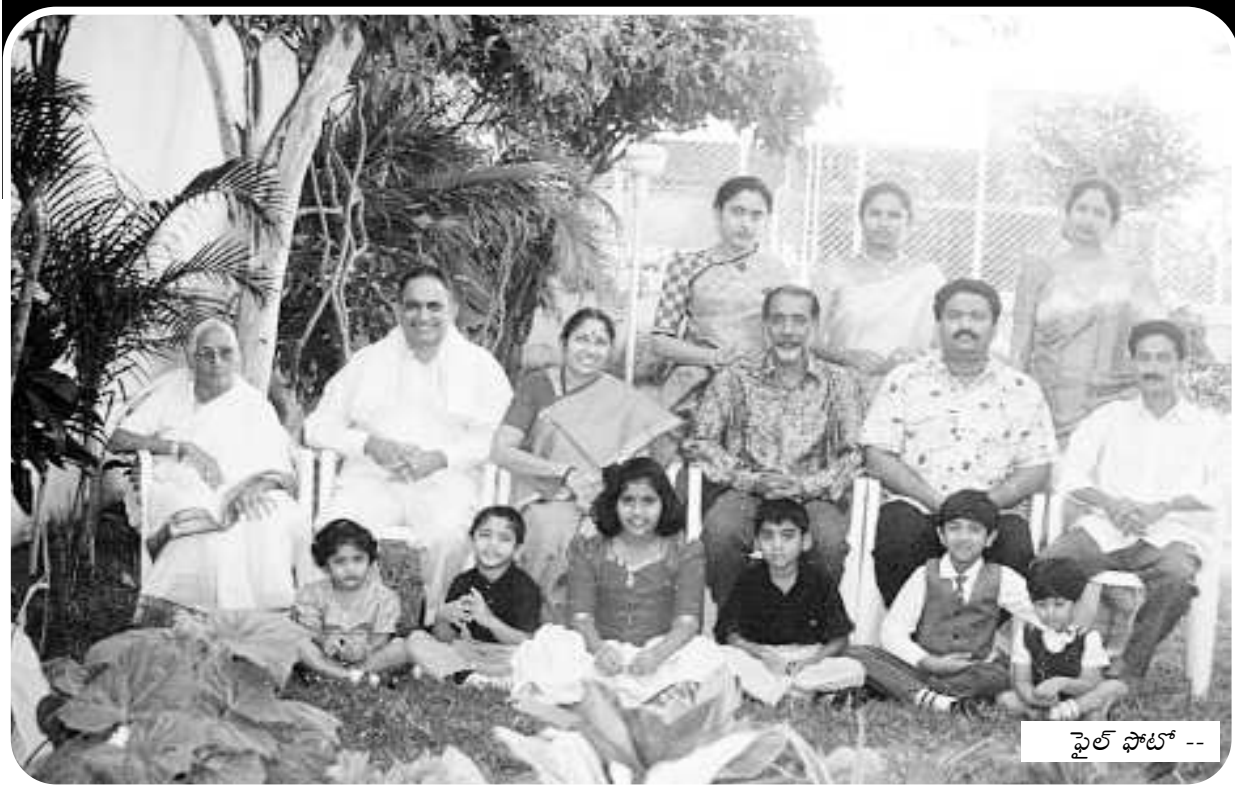
ఫైల్ ఫోటో --