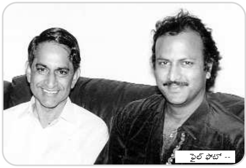
ఫైల్ ఫోటో --