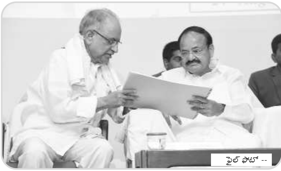
ఫైల్ ఫోటో --