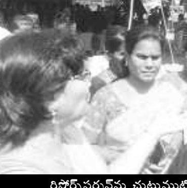
రిసోర్స్ పర్సన్ ను చుట్టుముట్టిన సంఘ సభ్యులు

అటు మున్సిపల్ పాలకవర్గం, ఇటు కమిషనర్ పట్టణమేకాకపోతే వీరి వలన జరిగే మేలు కంటే కీడే ఎక్కువని మంత్రి గుర్తిస్తే మంచిదని పలువురు కొరుతున్నారు.