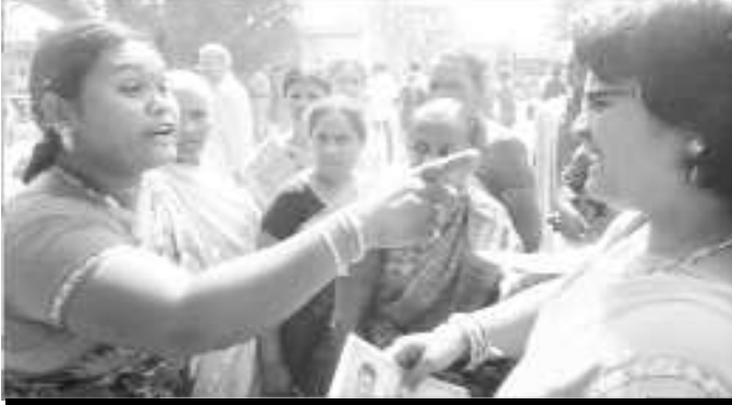
రిసోర్స్ పర్సన్ ను నిలదీస్తున్న విఘ్నేశ్వర సంఘ సభ్యురాలు