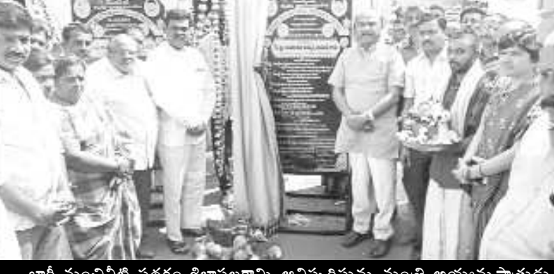
భారీ మంచినీటి పథకం శిలాఫలకాన్ని ఆవిష్కరిస్తున్న మంత్రి అయ్యన్నపాతుడు

నర్సపట్నం : రూ.1.25కోట్లతో నర్సపట్నంలో మోడల్ శ్మశానాన్ని ఏర్పాటు చేశామని రాష్ట్ర రోడ్డు భవనాలశాఖ మంత్రి చింతకాయల అయ్యన్నపాతుడు అన్నారు. మంగళవారం తహశీల్దార్ కార్యాలయం వివిధ రూ.142 కోట్లు 76 లక్షలతో పట్టణానికి తాగునీరు అందించే భారీ మంచినీటి పథకానికి మంత్రి శంకుస్థాపన చేశారు. రూ.23కోట్ల44 లక్షల వ్యయంతో సిబ్బంది పథకంలో పట్టణంలో సిసి రోడ్లు, కాలువలు, కల్యర్లు, డ్రైన్ల నిర్మాణం మొదలైన పనులకు శంకుస్థాపన చేశారు. రూ.1కోటి రూపాయలతో ఉత్తర వాహినీ వద్ద పార్కు నిర్మాణం, రూ.1కోటి25 లక్షలతో కొత్తవీధి సృజన వాటిక, రూ.3 కోట్లు 75 లక్షలతో