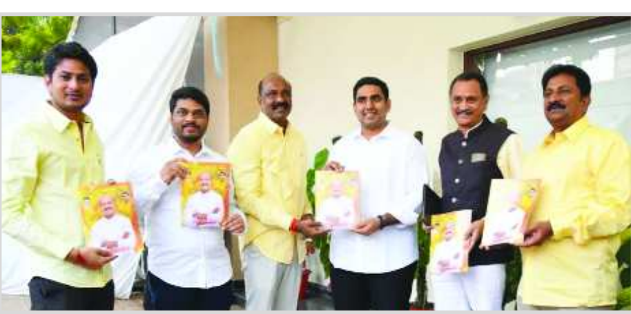
పశ్చిమ నియోజకవర్గములో గతంలో ఎన్నడు జరగని అభివృద్ధి కార్యక్రమాలను ఈ 5నంలో తనవైన శైలిలో అభివృద్ధి చేసి, ప్రజల మన్ననలు పొందిన మన గణబాబు ఆ కార్యక్రమా లన్నిటినీ ది టెక్నో-వైజాగ్ వెబ్స్ అనే పుస్తకంను రూపొందించి, ఆపుస్తకమును మంత్రివర్గాలు నారా లోకేష్ ఢిల్లీలో అవిస్కరించి, గణబాబు అభినందించారు. ఈ కార్యక్రమంలో మంత్రి శ్రావణ్ సత్యనారాయణ మొదలగునవ్వారు పాల్గొన్నారు.