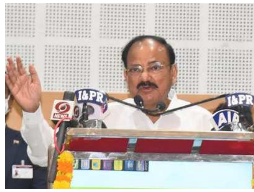
అందజేసినప్పుడే మన సంస్కృతి, సంప్రదాయాలు మనుగడ సాగించి, భవిష్యత్ తరాలను మేలైన మార్గంలో ముందుకు నడుపుతాయని సూచించారు.

తెలుగు భాష అభివృద్ధిని మాత్రమే తాను కోరుకోవడం లేదన్న ఉపరాష్ట్రపతి, అన్ని మాతృభాషలు తమ మనుగడను నిలబెట్టుకోవాలన్నదే తమ ఆకాంక్ష అని తెలిపారు. ఇటీవల ఆంధ్రప్రదేశ్ లోని 8 జిల్లాల్లో ఉన్న 920 పాఠశాలల్లో కోయ భాషలో ప్రాథమిక విద్యాబోధన చేస్తున్నారని తెలి ఎంతో ఆనందించానన్న ఆయన, ఈ విషయాన్ని ట్వీట్టర్ వేదికగా తెలిపానని, తెలుగు లిపి ద్వారా కోయ భాషను సంరక్షించే ప్రయత్నం చేస్తున్న రాష్ట్ర ప్రభుత్వం, విద్యాశాఖ అధికారుల చొరవను కచ్చితంగా అభినందించి తీరాల్సింది తెలిపారు. మాతృభాషను మాత్రమే నేర్చుకోమని తాను చెప్పడం లేదన్న ఉపరాష్ట్రపతి, మిగతా భాషలు నేర్చుకునే ముందు మాతృభాషలో వైపుణ్యం సాధించాలని సూచించారు. ఇందు కోసం తల్లిదండ్రుల చొరవ మరింత పెరగాలని ఆకాంక్షించారు.