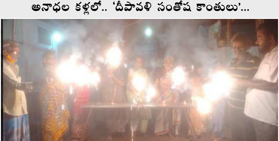
విశాఖపట్నం : వన్టోన్లో ఉన్న వివేకానంద అనాధ ఆశ్రమంలో.. దీపావళి సంబరాలు అంబరాన్నంటాయి.. అనాధల కళ్ళలో.. "దీపావళి సంతోష కాంతులు" మిరుమిట్లు గొలిపాయి.. పోయి.. ఆనంద సాగరంలో మునిగి పోయారు. అంతకముందు..లక్ష్మి దేవికి భక్తి శ్రద్ధలతో పూజలు నిర్వహించారు. ఆశ్రమం అంతటా దీపాలు వెలిగించారు. దీపాల కాంతుల్లో.. వారి మతాబులు, కాకరపువ్వులు, చిచ్చుబుడ్లు నయనాలు..తారల్లా.. దే దీప్యమైన కాంతులను ఉత్సాహంగా కాలుస్తూ..చిన్న పిల్లల్లా.. మారి విరజిమ్మాయి.