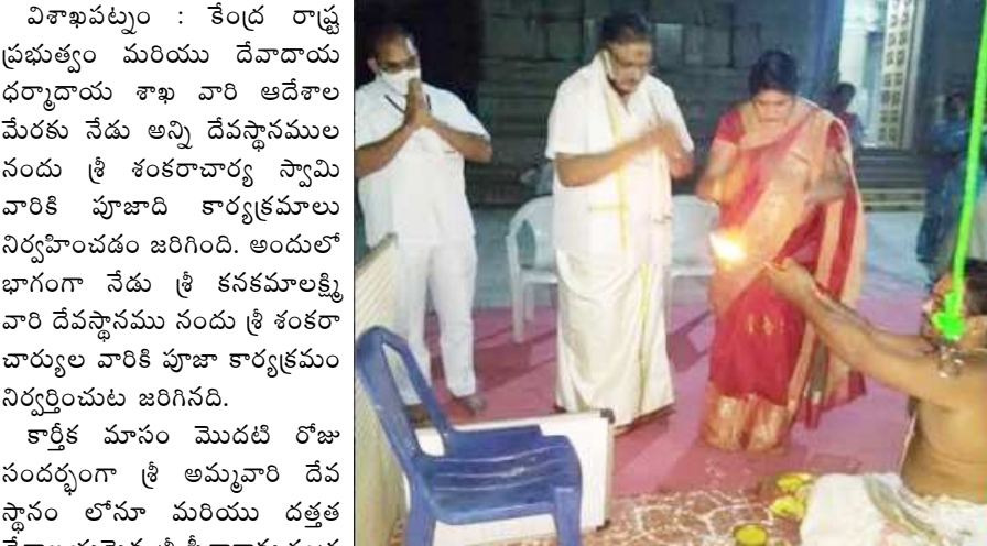
విశాఖపట్నం : కేంద్ర రాష్ట్ర ప్రభుత్వం మరియు దేవదాయ ధర్మాదాయ శాఖ వారి ఆదేశాల మేరకు నేడు అన్ని దేవస్థానముల నందు శ్రీ శంకరాచార్య స్వామి వారికి పూజాది కార్యక్రమాలు నిర్వహించడం జరిగింది. అందులో భాగంగా నేడు శ్రీ కనకమాలక్ష్మి వారి దేవస్థానము నందు శ్రీ శంకరాచార్యుల వారికి పూజా కార్యక్రమం నిర్వహించుట జరిగినది. కార్యక్రమం మొదటి రోజు సందర్భంగా శ్రీ అమ్మవారి దేవస్థానం లోనూ మరియు దత్తత దేవాలయమైన శ్రీ సీతారామచంద్ర స్వామి వారి దేవస్థానము లోనూ కార్యక్రమం అంతర్వేదికగా ఆకాశ దీపారాధన కార్యక్రమం నిర్వహించడం జరిగింది. ఈ కార్యక్రమంలో కార్యనిర్వహణా ధికారి వారు మరియు సహాయ కార్య నిర్వాహణాధికారి వారు దేవస్థానం వేద పండితులు అర్చకులు భక్తులు పాల్గొనడం జరిగినది.