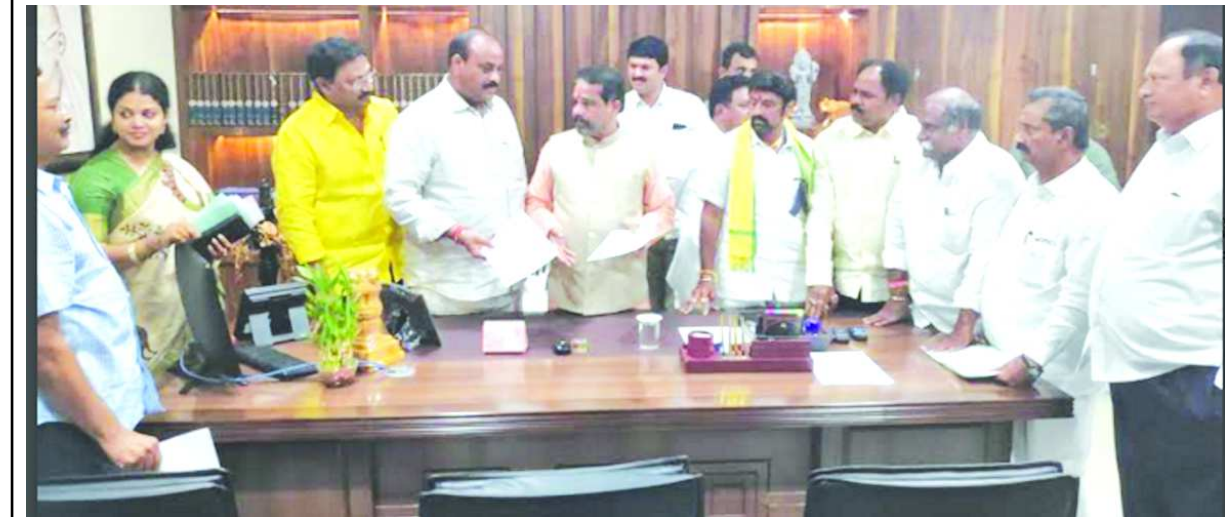
శాసనసభలో ప్రతిపక్షానికి సభలో మాట్లాడే అవకాశం ఇవ్వకపోవడం, సస్పెన్షన్ గురిన తెదేపా సభ్యుడికి ప్రత్యేకంగా సీటు కేటాయించడం, తదితర అంశాలలో జరుగుతున్న సభా సంప్రదాయాల ఉల్లంఘనలను పేర్కొంటూ, ప్రజాస్వామ్య విధానాలను కాపాడాలని టిడిపిల్ని నేతలు స్పీకర్ కు వినతి పత్రం అందచేశారు.