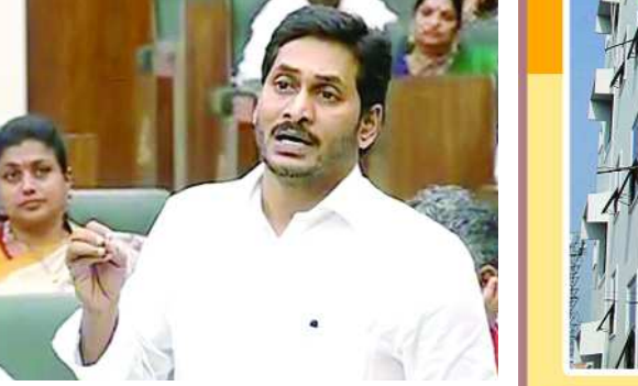
ఫాల్గొంటారని చాలా ఆశగా ఎదురుచూశానని, కానీ తన ధోరణి మారదన్నట్లుగానే చంద్రబాబు రాతేదని సీఎం జగన్ పేర్కొన్నారు. దాదాపు 11వేలకుపైగా గ్రామ సచివాలయాలు, మూడువేల వరకు వార్డు

అమరావతి: అధికారంలోకి వచ్చిన నాలుగు నెలల్లోనే అక్షరాల నాలుగు లక్షల ఉద్యోగాలు కల్పించడం అన్నది దేశ చరిత్రలోనే ఎక్కడా లేదని, అటువంటి మహాత్తరమైన పుట్టం ఆంధ్ర ప్రదేశ్ రాష్ట్రంలో జరిగిందని ముఖ్యమంత్రి వైఎస్ జగన్మోహన్ రెడ్డి అన్నారు. గ్రామ సచివాలయ ఉద్యోగాల ద్వారా అక్షరాల లక్షా 28వేల 858 మందికి అపాయింట్మెంట్ లెటర్లు ఇచ్చామని, వాళ్లంతా గ్రామ సచివాలయాల్లో ఈ రోజు పనిచేస్తున్నారని, ఇది ఎంతో సంతోషం కలిగించే విషయమని ఆయన తెలిపారు. గ్రామ సచివాలయాల అంశంపై బుధవారం అసెంబ్లీలో జరిగిన చర్చలో సీఎం వైఎస్ జగన్ మాట్లాడారు. వాలంటీర్లు, సచివాలయాల వ్యవస్థ లాంటి ఇంఫార్మేట్ సజ్జెక్ట్ మీద చర్చలో చంద్రబాబు