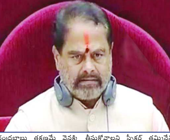
చంద్రబాబు తక్షణమే వెనక్కి తీసుకోవాలని స్పీకర్ తమ్మినేని సీతారాం డిమాండ్ చేశారు. మరోవైపు చంద్రబాబు వ్యాఖ్యలపై అధికార పక్షం భగ్గుమంది. స్పీకర్ ను ఉద్దేశించి ఆయన చేసిన వ్యాఖ్యలను సభ్యులు తప్పుపట్టారు. చంద్రబాబును సభ నుంచి సస్పెండ్ చేయాలని డిమాండ్ చేశారు.

స్పందించిన స్పీకర్.. ఇదేమన్నా ఖవాలి డ్యాన్సా? ఒకరి తర్వాత మరొకరికి అవకాశం ఇవ్వడానికి అంటూ వ్యాఖ్యానించారు. దీంతో తీవ్ర ఆగ్రహానికి గురైన ప్రతిపక్ష నేత చంద్రబాబు.. చైర్మన్ నుంచి తేచి మరీ స్పీకర్ తో వాగ్వివాదానికి దిగారు. మర్యాదగా ఉండాలంటూ స్పీకర్ నుద్దేశించి చంద్రబాబు వ్యాఖ్యానించారు. దీంతో సభలో తీవ్ర గందరగోళం నెలకొంది. బాబు వ్యాఖ్యలపై స్పీకర్ ఆగ్రహం వ్యక్తం చేశారు. తన పట్ల అనుచితంగా మాట్లాడారంటూ ఫైర్ అయ్యారు. స్పీకర్ చైర్మన్ అవమానించారంటూ మండిపడ్డారు. మీ మీద నాకు గౌరవం ఉంది. కానీ ఇష్టానుసారం స్పీకర్ పై ఆరోపణలు చేస్తే మంచిది కాదు అని చంద్రబాబును స్పీకర్ హెచ్చరించారు. స్పీకర్ చైర్మన్ చంద్రబాబు ఏమాత్రం గౌరవించడం లేదన్నారు. ఇంత సీనియారిటీ ఉండి ఏం లాభం అని ప్రశ్నించారు. తనపై చేసిన వ్యాఖ్యలను