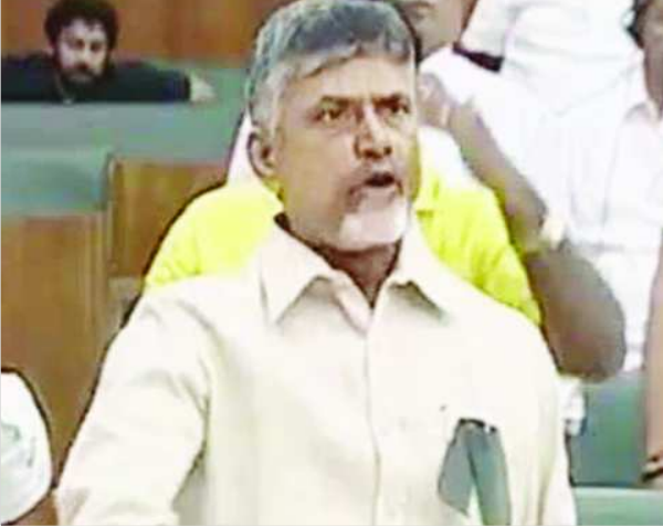
అమరావతి: మూడో రోజు అసెంబ్లీ సమావేశాల్లో తీవ్ర గందరగోళం నెలకొంది. సభలో స్పీకర్ వర్గం టీడీపీ అసభ్యులకు పరిస్థితి నెలకొంది. తెలుగు మీడియం స్కూళ్లపై చర్చ సందర్భంగా తమకు మాట్లాడే అవకాశం ఇవ్వాలంటూ టీడీపీ నేతల పట్టుబట్టారు. ఈ సందర్భంగా

స్పందించిన స్పీకర్.. ఇదేమన్నా ఖవాలి డ్యాన్సా? ఒకరి తర్వాత మరొకరికి అవకాశం ఇవ్వడానికి అంటూ వ్యాఖ్యానించారు. దీంతో తీవ్ర ఆగ్రహానికి గురైన ప్రతిపక్ష నేత చంద్రబాబు.. చైర్మన్ నుంచి తేచి మరీ స్పీకర్ తో వాగ్వివాదానికి దిగారు. మర్యాదగా ఉండాలంటూ స్పీకర్ నుద్దేశించి చంద్రబాబు వ్యాఖ్యానించారు. దీంతో సభలో తీవ్ర గందరగోళం నెలకొంది. బాబు వ్యాఖ్యలపై స్పీకర్ ఆగ్రహం వ్యక్తం చేశారు. తన పట్ల అనుచితంగా మాట్లాడారంటూ ఫైర్ అయ్యారు. స్పీకర్ చైర్మన్ అవమానించారంటూ మండిపడ్డారు. మీ మీద నాకు గౌరవం ఉంది. కానీ ఇష్టానుసారం స్పీకర్ పై ఆరోపణలు చేస్తే మంచిది కాదు అని చంద్రబాబును స్పీకర్ హెచ్చరించారు. స్పీకర్ చైర్మన్ చంద్రబాబు ఏమాత్రం గౌరవించడం లేదన్నారు. ఇంత సీనియారిటీ ఉండి ఏం లాభం అని ప్రశ్నించారు. తనపై చేసిన వ్యాఖ్యలను