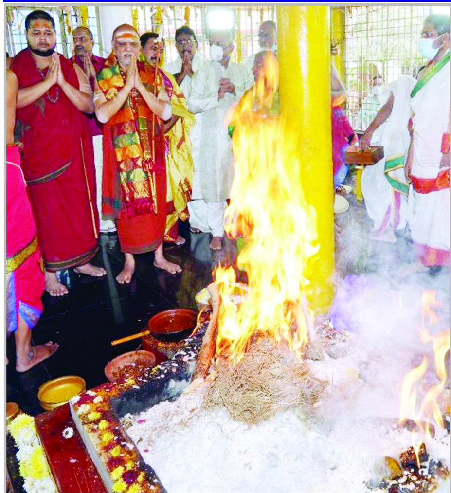
విశాఖ శ్రీ శారదాపీఠం వార్షిక మహోత్సవాల సందర్భంగా ఐదు రోజులపాటు నిర్వహించిన రాజశ్యామల యాగంలో అద్భుతం చోటు చేసుకుంది. పూర్ణాహుతి సమయంలో రేగిన యాగ జ్వాలలో ఓంకారం దర్శనమిచ్చింది. ఈ అద్భుత దృశ్యం స్థానికుల కెమెరాకు చిక్కింది. యజ్ఞ యాగాదులు నిర్వహిస్తున్నప్పుడు ఇలాంటి అద్భుతాలు అరుదుగా చోటు చేసుకుంటాయి.