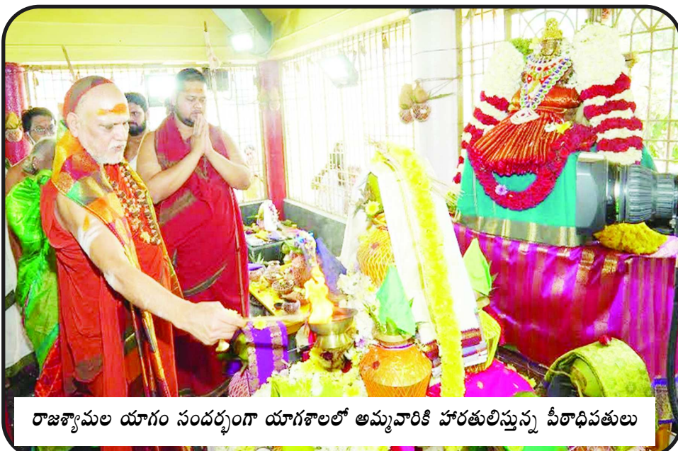
రాజశ్యామల యాగం సందర్భంగా యాగశాలలో అమ్మవారికి హారతులిస్తున్న పీఠాధిపతులు