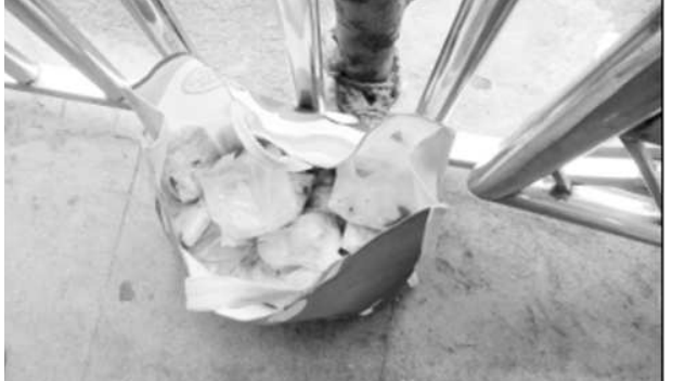
అక్రమంగా తరిస్తున్న అప్పన్న లడ్డూలు

విశాఖపట్నం: సింహాచలం శ్రీ సింహాద్రి నాథుని ప్రసాదాల అమ్మకాలలో భాగంగా అవినీతి జరుగుతుంది అనడానికి మరో నిదర్శనం శనివారం ఒక బ్యాంక్ అవుట్ సొర్టింగ్ ఉద్యోగి 90 అప్పన్న లడ్డూలను ఎటువంటి టిక్కెట్ గాని పై అధికారుల నుండి పరీక్షించి ఉత్తరం గాని లేకుండా ఎదేచ్చగా బయటకు తీసుకువస్తూ సెక్యూరిటీ సిబ్బందికి దొరికిపోవడంతో మరోసారి ప్రసాదాల విక్రయాలలో భారీ అవినీతి జరుగుతుందని తెలుస్తుంది. ఇందుకు ప్రధానకారణం ఉన్నతాధికారులు వీరిపై ఎటువంటి చర్యలు తీసుకోవడం వలన కొందరు ఎదేచ్చగ ప్రవర్తిస్తూ నిబంధనలకు విరుద్ధంగా అమ్మకాలు సాగిస్తూ అప్పన్న ఖజానాకు గండి కొడుతున్నారు. 1700 లడ్డూలు లెక్కల్లో లేవని అవినీతి జరిగిందని అధికారిని రిపోర్టులో తేల్చినా కంటితుడుపుగా వారితో డబ్బులు కట్టించి దోపిలను వదిలేసారు. మరలా శనివారం లడ్డూలు బయటకు తరిపోవడానికి కారణం పైఅధికారుల ఉదాసీనతే కారణం ఇప్పటికైనా అధికారులు లోతుగా విచారణజరిపి దోపిలను బయటకులాగి ప్రక్షాళన చేయాలని భక్తులు కోరుకుంటున్నారు.