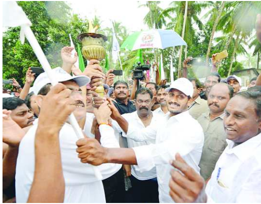
సంబరాలు ఘనంగా నిర్వహించారు. వైఎస్ జగన్ చింతపల్లి వద్ద ఒలింపిక్ జ్యోతిని వెలిగించారు. తూర్పు గోదావరి జిల్లాలోని పలువురు క్రీడాకారులు, క్రీడా సంఘాల ప్రతినిధులు, వివిధ పాఠశాలల విద్యార్థిని విద్యార్థిని ఆభిమానులు, పెద్ద సంఖ్యలో పాల్గొన్నారు.

రాజ్ కుటుంబం: విద్యార్థి దశ నుంచే క్రీడల పట్ల దృష్టి సారించాలని, క్రీడలు జీవితంలో భాగస్వామ్యం కావాలని వైఎస్సార్ సీపీ అధ్యక్షుడు, రాష్ట్ర ప్రతి పక్ష నేత వైఎస్ జగన్మోహన్ రెడ్డి పిలుపునిచ్చారు. ఒలింపిక్ దినోత్సవ సందర్భంగా తూర్పు గోదావరి జిల్లాలో జరుగుతున్న ప్రజా సంకల్ప యాత్ర జరుగుతున్న రాజ్ కుటుంబం మండలంలో స్థానిక క్రీడా సంఘాలు నిర్వహించిన ఒలింపిక్ పరుగును జెండా ఊపి ఒలింపిక్ రన్ ను ఆయన ప్రారంభించారు. ఈ సందర్భంగా ఆయన మాట్లాడుతూ విద్యార్థి దశ నుంచే క్రీడల పట్ల అవగాహన పెంచి, శారీరకంగా బలంగా తయారయ్యేలా చేయాలన్నారు. క్రీడలను కేవలం వ్యాయామం వరకే చెయ్యకుండా, రాష్ట్ర స్థాయి, జాతీయ స్థాయిలో ఉత్తమ ప్రతిభ కనపరచేలా తీర్చిదిద్దాలన్నారు. ప్రజా సంకల్ప యాత్రలో శనివారం ఒలింపిక్ డే