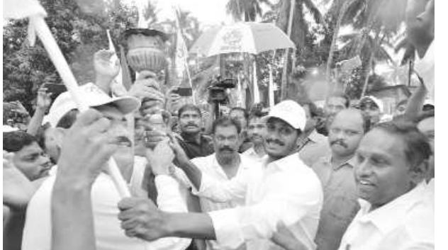
తూర్పుగోదావరి జిల్లా రాజీలు మండలం చింతపల్లి వద్ద ప్రతి వక్రవేత వైఎస్ జగన్ ఒలింపిక్ దినోత్సవం సందర్భంగా ఒలింపిక్ రనను ప్రారంభించారు. ఈ కార్యక్రమంలో పలువురు క్రీడాకారులు, విద్యార్థులు, కార్యకర్తలు పాల్గొన్నారు

విశాఖపట్నం: సింహాచలం శ్రీ సింహాద్రి నాథుని ప్రసాదాల అమ్మకాలలో భాగంగా అవినీతి జరుగుతుంది అనడానికి మరో నిదర్శనం శనివారం ఒక బ్యాంక్ అవుట్ సొర్టింగ్ ఉద్యోగి 90 అప్పన్న లడ్డూలను ఎటువంటి టిక్కెట్ గాని పై అధికారుల నుండి పరీక్షించి ఉత్తరం గాని లేకుండా ఎదేచ్చగా బయటకు తీసుకువస్తూ సెక్యూరిటీ సిబ్బందికి దొరికిపోవడంతో మరోసారి ప్రసాదాల విక్రయాలలో భారీ అవినీతి జరుగుతుందని తెలుస్తుంది. ఇందుకు ప్రధానకారణం ఉన్నతాధికారులు వీరిపై ఎటువంటి చర్యలు తీసుకోవడం వలన కొందరు ఎదేచ్చగ ప్రవర్తిస్తూ నిబంధనలకు విరుద్ధంగా అమ్మకాలు సాగిస్తూ అప్పన్న ఖజానాకు గండి కొడుతున్నారు. 1700 లడ్డూలు లెక్కల్లో లేవని అవినీతి జరిగిందని అధికారిని రిపోర్టులో తేల్చినా కంటితుడుపుగా వారితో డబ్బులు కట్టించి దోపిలను వదిలేసారు. మరలా శనివారం లడ్డూలు బయటకు తరిపోవడానికి కారణం పైఅధికారుల ఉదాసీనతే కారణం ఇప్పటికైనా అధికారులు లోతుగా విచారణజరిపి దోపిలను బయటకులాగి ప్రక్షాళన చేయాలని భక్తులు కోరుకుంటున్నారు.