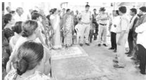
గ్రామస్థులతో మాట్లాడుతున్న అధికారులు