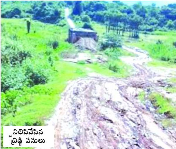
నిలిపివేసిన బిడ్డి పనులు

అనంతగిరి : గరుగుబిల్లి పంచాయతీ గ్రామ సమీపంలో ఉన్న బిడ్డి పనులు పూర్తిగా నిలిపివేశారు బిడ్డి అవతల వైపు అనంతగిరి