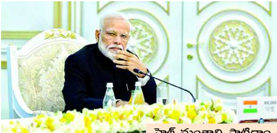
హెల్త్ మంత్రిని పోటీదాం..

బిష్కెక్: ఉగ్రవాదానికి మద్దతిస్తూ ఉగ్రవాదులకు ఆర్థిక సహకారం అందించే దేశాలు జవాబుదారీగా ఉండాలని భారత ప్రధాని నరేంద్రమోదీ అన్నారు. కిర్గిస్థాన్ రాజధాని బిష్కెక్లో జరుగుతున్న షాంఘై సహకార సదస్సులో మోదీ పాల్గొని ప్రసంగించారు. ఈ సందర్భంగా దాయాది దేశం పాకిస్తాన్కు ఆ దేశ ప్రధాని ఇమ్రాన్ ఖాన్ ఎదుడే పరోక్షంగా గట్టి హెచ్చరికలు చేశారు. కొన్ని దేశాలు ఉగ్రవాదాన్ని ప్రోత్సహిస్తున్నాయని, దాన్ని అరికట్టాలని మోదీ అన్నారు. ఉగ్రవాదులకు మద్దతిచ్చే దేశాలను బహిష్కరించాల్సిన అవసరం ఉందన్నారు. ఉగ్రవాదంపై షాంఘైలో ఎన్సీవో దేశాలు పరస్పర సహకారం అందించుకోవాలని తరువాతి 2లో..