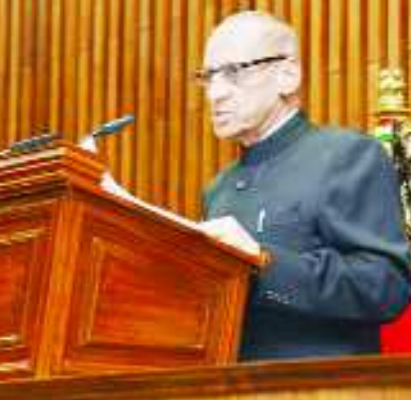
పర్యవసానాలుగా ఉన్నాయని, మానవ, భౌతిక వనరుల దుర్వినియోగపర్యటం రాష్ట్రం యొక్క దుస్థితిని మరింత తీవ్రతరం చేసిందని అభిప్రాయ పడ్డారు. అవినీతి రహిత.. తరువాతి 2లో..

అమరావతి : నవరత్నాలను ప్రతి ఇంటికీ చేరుస్తామని గవర్నర్ నరసింహన్ స్పష్టం చేశారు. కొత్తగా కొలువుదీరిన రాష్ట్ర శాసనసభ సభ్యులతో పాటు శాసనమండలి సభ్యులను ఉద్దేశించి శుక్రవారం ఆయన ప్రసంగించారు. ముఖ్యమంత్రి వైఎస్ జగన్మోహన్రెడ్డి నేతృత్వంలోని కొత్త ప్రభుత్వం పరిపాలన లక్ష్యాలను, విధానాలను ప్రతిబింబించేలా ఆయన ప్రసంగం కొనసాగింది. రాష్ట్ర శాసనసభకు ఎన్నికైన సభ్యులందరికీ శుభాకాంక్షలు తెలుపుతూ గవర్నర్ తన ప్రసంగాన్ని ప్రారంభించారు. 2019 సాధారణ ఎన్నికల తర్వాత ఏర్పడిన కొత్త ప్రభుత్వానికి అభినందనలు తెలియజేశారు. నూతన ప్రభుత్వానికి తక్షణ సమస్యలపై దృష్టి పెట్టాల్సిన సమయం ఆసన్నమైందని సూచించారు. రాష్ట్ర విభజనానంతరం తలెత్తిన సవాళ్లు అసంగతమైన నిరోధాణకు