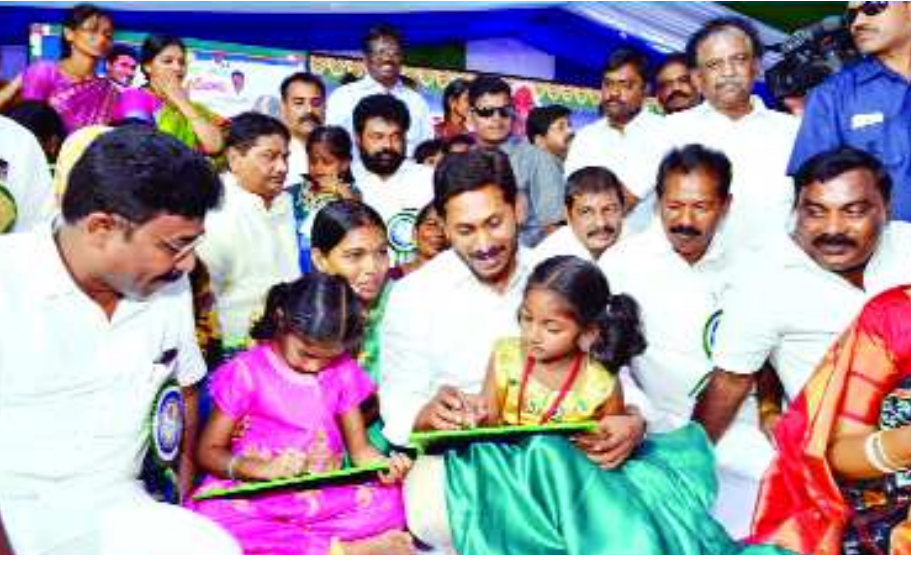
ప్రసంగించారు. పాదయాత్రలో ప్రతి తల్లికి, చెల్లికి అన్నారూ. మీ పిల్లలను బడికి పంపిస్తే చాలు.. ఇచ్చిన హామీని నిలబెట్టుకున్న సందర్భంగా ఇవాళ వారికి మామూలు అండగా ఉంటామని అని భరోసా చాలా సంతోషంగా ఉందని ముఖ్యమంత్రి ఇచ్చారు. నిల్వలను బడికి తరువాతి 2లో..

గుంటూరు: రాష్ట్రంలో చదువుల విప్లవం తీసుకొస్తామని, రెండేళ్లలో ప్రభుత్వ పాఠశాలల రూపురేఖల్ని మార్చేస్తామని ముఖ్యమంత్రి వైఎస్ జగన్మోహన్రెడ్డి హామీ ఇచ్చారు. (వెబెట్ స్కూళ్లకు దీటుగా ప్రభుత్వ పాఠశాలలను తీర్చిదిద్దడామని ఆయన తెలిపారు. గుంటూరు జిల్లా పెనుమాక జెడ్పీ స్కూల్లో ఏర్పాటు చేసిన రాజన్న బడిబాట సామూహిక అక్షరాభ్యాసం కార్యక్రమంలో సీఎం పాల్గొని