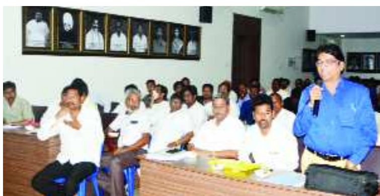
జిల్లాలో జరిగిన పార్లమెంట్, శాసన సభ ఎన్నికల్లో మొత్తం 210 మంది అభ్యర్థులు పోటీ చేశారన్నారు, వారిలో 68 మంది అభ్యర్థులు ఇప్పటికే తమ ఎన్నికల వ్యయ నివేదికలను తమకు అందజేయడం జరిగిందన్నారు.

జిల్లాలో జరిగిన పార్లమెంట్, శాసన సభ ఎన్నికల్లో మొత్తం 210 మంది అభ్యర్థులు పోటీ చేశారన్నారు, వారిలో 68 మంది అభ్యర్థులు ఇప్పటికే తమ ఎన్నికల వ్యయ నివేదికలను తమకు అందజేయడం జరిగిందన్నారు. మిగిలిన అభ్యర్థులు ఇంకా అందజేయాల్సి ఉందన్నారు. ఎన్నికల వ్యయ పరిశీలకులు ఈ నెల 17 న జిల్లాకు వస్తున్నారన్నారు, వారికి ఈ నివేదికలు అందజేయాల్సి ఉందన్నారు. ఎన్నికల వ్యయ మేన్యుయల్లో నిర్దేశించిన విధంగా నిర్ణీత ప్రాసెజుర్లలో అంశాల వారీగా ఎన్నికల వ్యయ నివేదికలను అందజేయాల్సి ఉంటుందని ఆమె తెలిపారు. ఈ ఎన్నికల వ్యయ నివేదికలపై అభ్యర్థుల ప్రతినిధులు సంతకం చేసినా పరవాలేదని, అయితే అఫడవిట్ పై అభ్యర్థులు మాత్రమే సంతకం చేయాల్సి ఉంటుందని ఆమె తెలిపారు. ఈ నెల 18 కల్లా ఎన్నికల వ్యయ నివేదికలను అందజేస్తే 22 కల్లా తుది వ్యయ నివేదికలను ఖరారుచేస్తామని ఆమె తెలిపారు. ఎన్నికల